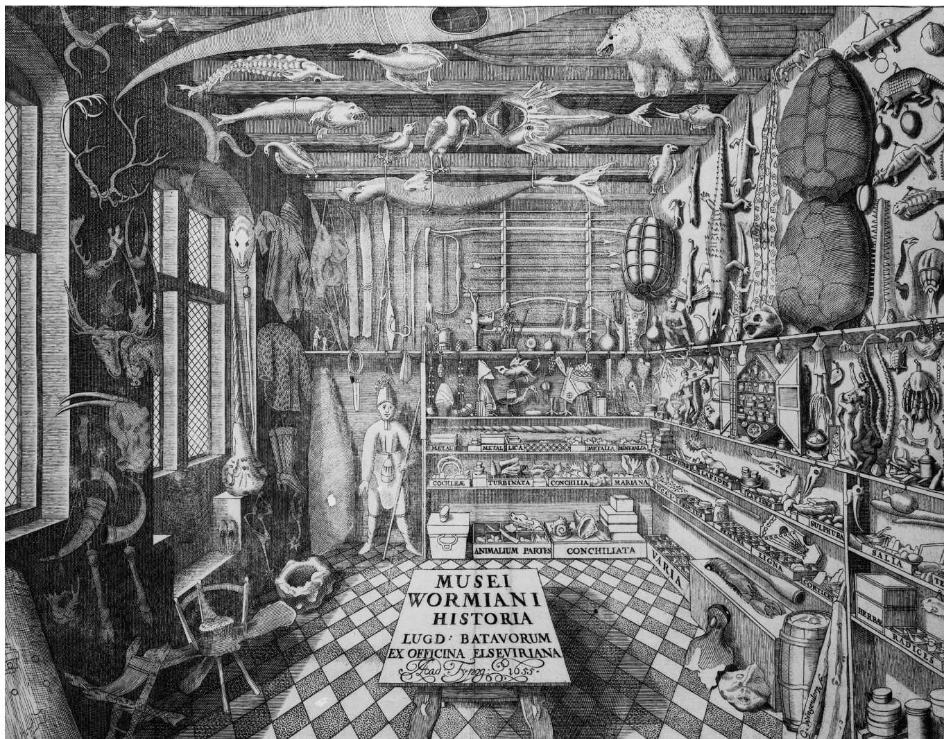
1. kép. Ole Worm 17. századi dán fizikus, természettudós Wunderkammerja, a Museum Wormianum. British Museum, ltsz. 1872,0511.1004

Manfred Fuhrmann Klasszikusok kommentárral? című tanulmányának, a kommentár történetéről szóló szakaszában több érdekes metaforát is használ a kommentár általános jellemzőinek tárgyalásakor. Elsőként a könyvnyomtatás után elterjedt kommentált kiadások kommentárrészét hasonlítja