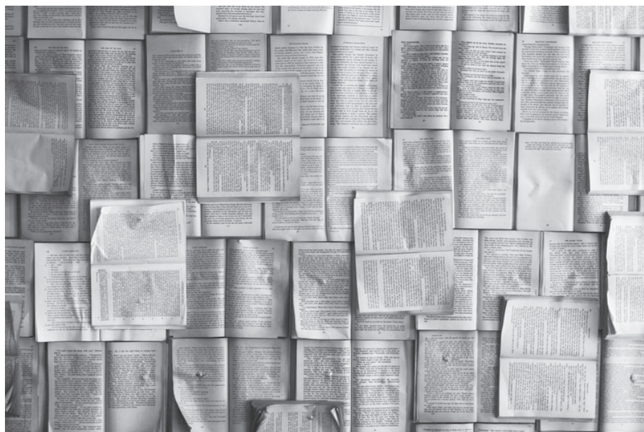
4. kép.

A két kommentárszerző tehát többnyire másként bontotta atomjaira az Odysseia XIX. énekének vizsgált szövegrészletét, és részben más intenzitással és formában magyarázta azokat, mégis hasonló megfontolással, a funkcionalitásra törekedve készítették kommentárjaikat. Milyen használatot feltételeznek ezek alapján a kommentárok? Megítélésem szerint az oxfordi kommentár elsősorban a kommentárt a szöveg mellett vagy után, folyamatosan, ha nem is az elejétől a végéig egybefüggően, de többnyire megszakítás nélküli olvasói figyelemre számít, szerkezetével, kommentálási gyakorlatával ennek a kommentárhasználó-típusnak kedvez. A cambridge-i kommentár ezzel szemben talán inkább épít a „rajtaütésszerű” kommentárhasználói gyakorlatra, hiszen a kommentárjegyzetei rövidek, tömörek és sok esetben kézikönyvbéli szócikkekként funkció-