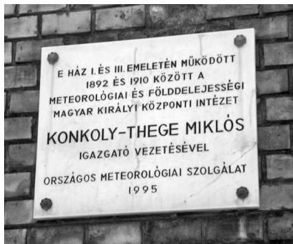
Konkoly Thege Miklós meteorológiai munkásságának állított emléket az Országos Meteorológiai Szolgálat a Fő utca 6. számú ház falán. Itt ért véget csillagsétánk

Közeledtünk sétánk végállomásához, a Fő utca 6. számú házhoz. Itt ismét emléktábla könnyítette meg dolgunkat: 1892 és 1910 között itt működött meteorológiai és földdelejességi intézet, Konkoly Thege Miklós igazgatása alatt. Ez az időszak a magyarországi meteorológia fellendülésének korszaka volt, a mérőállomások száma sokszorosára nőtt, és az intézet innen már ma is használt székházába költözött a Kitaibel Pál utcába. Ebben a fejlődésben óriási szerepe volt