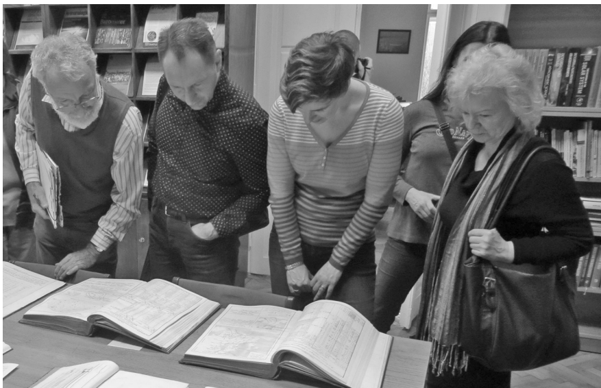
Csoportunk tagjai az Országos Meteorológiai Szolgálat könyvtárában