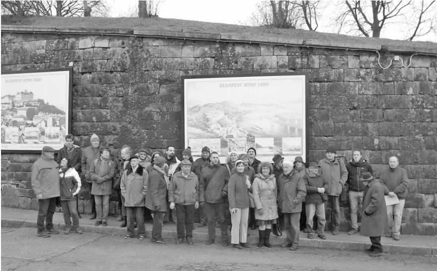
Csapatunk a Citadellánál. Ez volt az eddigi legnépesebb csillagsétánk