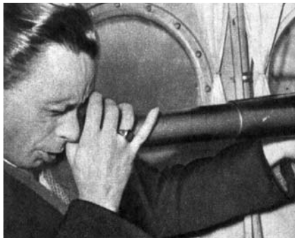
Az 1961-es Merkúr-átvonulás megfigyelése közben – egy repülőgép fedélzetén

A hetvenes években még óriási példányszámban jelent meg az Élet és Tudomány,