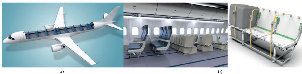
5. ábra Az utastér kombi kialakítása együttes utas- és teherzállításra [2], [10]

Egyidejű, egy térben történő közös, biztonságos utas- és teherzállítási lehetőséget, úgynevezett kombi megoldást is kidolgoztak, amely keskeny és széles törzsű repülőgépeken egyaránt alkalmazható minimális belsőtér-átrendezéssel (5. a) ábra). A szabadon hagyott ülések vázaiba e célra készült, megfelelő méretű konténerek rögzíthetők hevederrel (5. b) ábra).