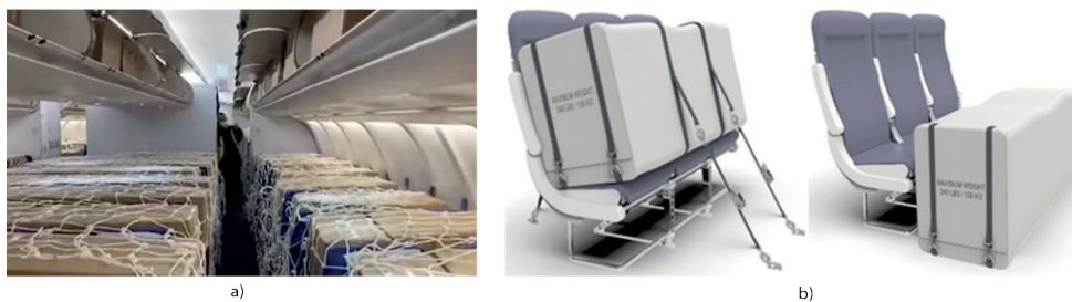
4. ábra Teheráru-szállítási lehetőségek utastérben [2], [9]

E megoldások hátránya, hogy az ülésekre, lábtérbe, felső csomagtárolókba jellemzően csak kisebb tömegű áruk pakolhatók, a rakodás az utasajtók mérete miatt körülményesebb és több időt vesz igénybe. (Így érkeztek Magyarországra kínai egészségügyi szállítmányok is.)