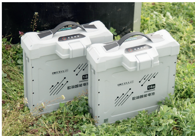
4. ábra Az Okcell 18S akkumulátor [1]

Az energiaellátásért jelenleg egy 18S 28 000 mAh teljesítményű akkumulátor felelős (4. ábra). A repülési idő üresen akár a 30 min-t is elérheti, a jelenlegi payloaddal pedig 20 min repülést tesz lehetővé. Ez pontosan egytartálynyi vegyszer kijuttatására alkalmas, illetve a maximum távolság megtételére kétszer +20% tartalék.