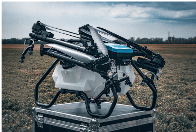
2. ábra A multikopteres drón [2]