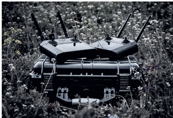
3. ábra A H12 távirányító [1]