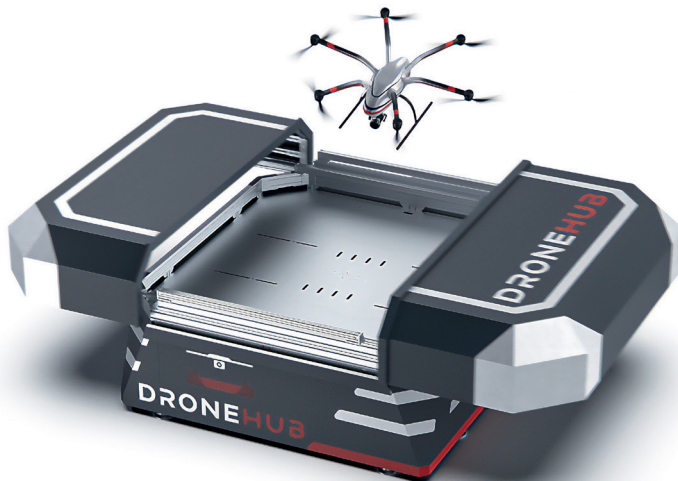
2. ábra Drone-in-a-box [10]

ellátási helyéhez képest a optimálisan kivitelezhető, ezzel tovább növelve az adott eszköz hatékonyságát. Az eszköz folyamatos töltése és megfigyelése miatt a külső behatásoktól, mint például eső, hőmérséklet-változás vagy vandalizmus állandó jelleggel védve van. Ez a fajta tárolás magas mobilitást biztosít a drónnak, mivel folyamatosan felszállásra kész üzemmódban tartja az eszközt.