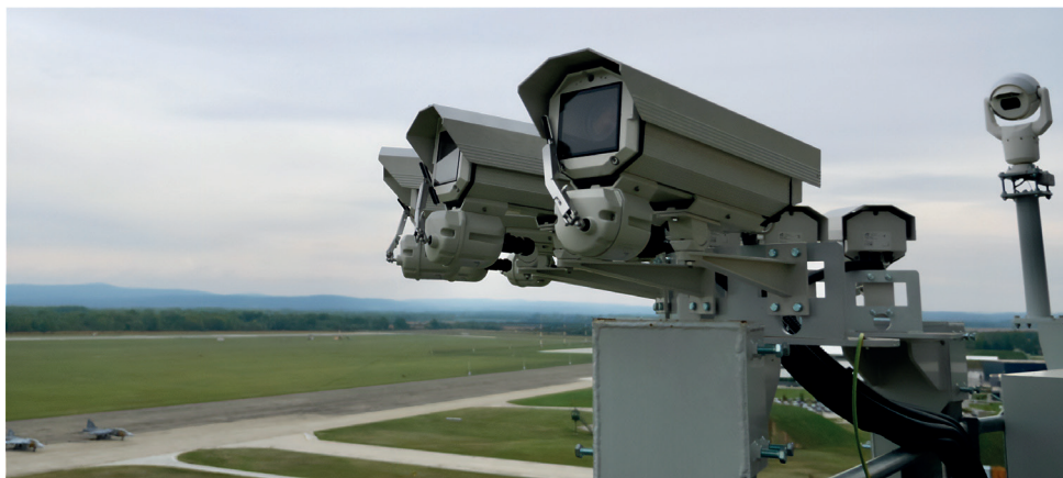
1. ábra LHPA rTWR kamerakonfiguráció

A konfiguráció által szolgáltatott nyers képinformációk feldolgozására, valamint a panorámakép összefűzésére nem a helyszínen, hanem a budapesti központban került sor. Az adatkapcsolatot egyetlen – nem redundáns – vezeték nélküli hálózat biztosította, amely tökéletesen elégségesnek bizonyult a projekt hatókörébe helyezett passzív forgalomkövetés szükségletének kielégítésére, de tényleges légi forgalmi irányító tevékenység biztosításához már nem megfelelő ez a konfiguráció. Ez a nem megfelelő értékelés elsősorban abból fakad, hogy a redundancia a légi forgalmi szolgáltatásokra vonatkozó egyik legfontosabb alapkövetelmény [12], amellyel kapcsolatban azt is hangsúlyoznom kell, hogy a valós irányítói tevékenység érdekében a képfeldolgozást és az adatkonvertálást az adott telepítési helyszínen kell megoldani, aminek eredményeként érdemben csökken a továbbítható mozgókép-információk mérete, így a rendelkezésre álló sávszélesség optimalizálható, és ennek köszönhetően a redundancia biztosítása is egyszerűbbé válik [13].