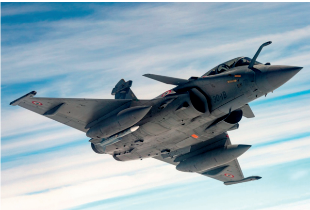
1. ábra Rafale [7]

Egy Rafale ára nagyjából 100 millió USD.