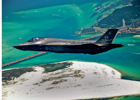
5. ábra F-35 [8]

Egy F-35-ös ára körülbelül 78 millió USD, ami nem tűnik soknak azért a tudásért, amelyet nyújtani képes a felhasználó számára.