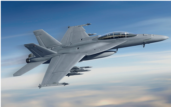
4. ábra F/A-18 [16]

A repülőgép felfegyverzési filozófiájára egy ismert amerikai felfogás a jellemző, amely az egész gép koncepcióját is markánsan meghatározza, ez nem más, mint a „minél többet minél messzebbre” szemléletmód. Ez jól felismerhető az egy időben függeszthető rakéták és a precíziós bombák nagy számában, ami maximum 4,5 t megsemmisítő eszköz lehet összesen. Egy Super Hornet ára körülbelül 66 millió USD, ami meglepően olcsó az előző típusokhoz képest.