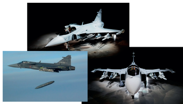
2. ábra Gripen E (Major Gábor szerkesztése [9], [10] alapján)