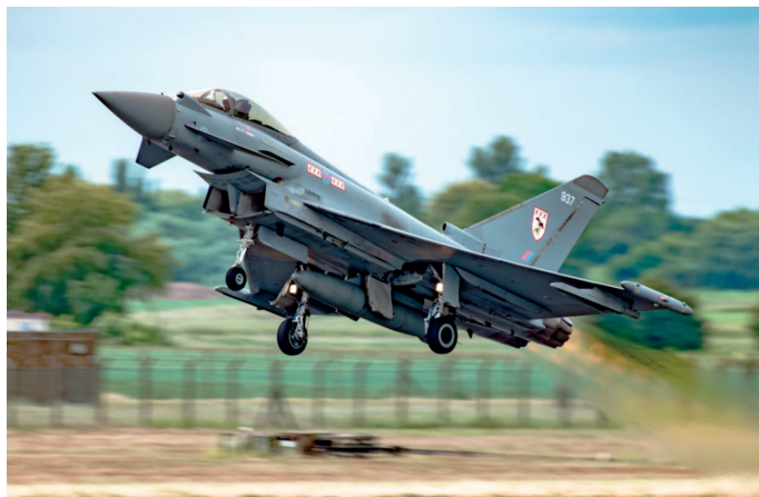
3. ábra Eurofighter [20]

Egy Eurofighter ára nagyjából 124 millió USD. (Ha figyelembe vesszük a gyártásból adódó meghibásodások jelentősen nagy számát, akkor az ár-érték arány nincs egyensúlyban. A nagy számú hibákról számos híradás számolt már be, illetve a 2021-es kecskeméti repülőnapon is meghibásodás miatt maradt ki az egyik bemutató.)