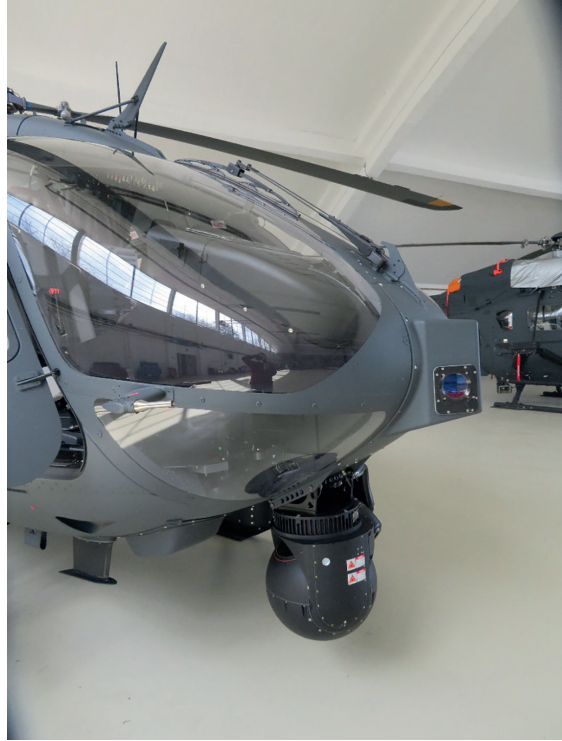
4. ábra Az EOS egy H145M helikopteren, hordhelyzetben [6]

Az alkalmazható fegyverek típusa – amely lehet csupán ballisztikus és/vagy irányítható fegyver – attól függ, hogy a megrendelő milyen fegyveropcióval és milyen szintű HForce-képességsomaggal rendelte meg a H145M helikoptert. A különböző fegyverkonténerek lehetővé teszik géppuskák, gépágyúk és különböző rakéták alkalmazását a helikopter repülési irányában a hossz tengely mentén. A fegyverzet rögzítésére a többcélú pilonok (MPP) 22 (lásd 5. ábra), valamint a függesztményrögzítő rendszer (SRU) szolgál. Az SRU többfajta, közepes tömegű fegyver függesztésére is alkalmas, köszönhetően a NATO-szabványú 14"-es (355,6 mm-es) függesztőszemeknek. Az SRU, köszönhetően az egyszerűen használható mechanikus kezelőszerveinek, lehetővé teszi a konténerek gyors függesztését, beállítását és repülés utáni lefüggesztését. A konténerek vészhelyzet esetén egyidejűleg is leoldhatók, köszönhetően a vészoldó berendezésnek, amely független a HForce-rendszertől. A konténerek véletlen tüzelés és oldás elleni földi biztosítására az SRU-n speciális biztosító tuskék (földi biztosítók) szolgálnak. A különböző konténerekhez saját oldható kábel tartozik, amely duplex kommunikációt biztosít a berendezés és a konténer között, ilyen lehet például az újratöltésre, a sorozathosszra, a tűzparancsra stb. vonatkozó jelek, a HForce-rendszer irányába pedig a konténer állapotáról például tűzkésztség, meghibásodás stb. Minden konténer rendelkezik saját