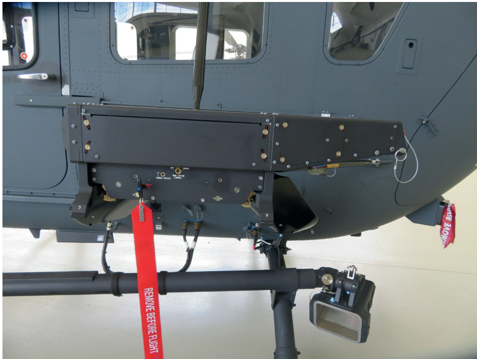
5. ábra A H145M helikopter függesztő rendszere (SRU) [6]

biztosító rendszerrel is, amely lehetővé teszi azok biztonságos földi kiszolgálását is (töltés/ürítés/fesztelenítés/akadályelhárítás stb.) [4]. A HForce-rendszer lehetővé teszi a szabvány tüzérfegyverek, 12,7 mm-es géppuska és/vagy 20 mm-es gépágyú, 70 mm-es irányítható-, és nem irányítható rakéták alkalmazását blokkokból, valamint irányítható páncéltörő rakéták (Rafael Spike ER) alkalmazását is. Köszönhetően a HForce-rendszer többcélú és moduláris felépítésének, nem szabvány nyugati/NATO-fegyvereket is alkalmazhatnak, mint ami meg is történt a szerb haderő számára leszállított H145M helikopterek 23 esetében. A HForce-rendszer szoftveres és hardveres továbbfejlesztésének köszönhetően fejlett hadművelleti rendszerek (Link16 adatátviteli és L3 Downlink videóátjátszó) is integrálhatók a helikopter fedélzetére, ezáltal kiemelkedő képességű légi vezetés-irányítási és felderítő (C4ISR 24 ) rendszerré is válhat [4], [8].