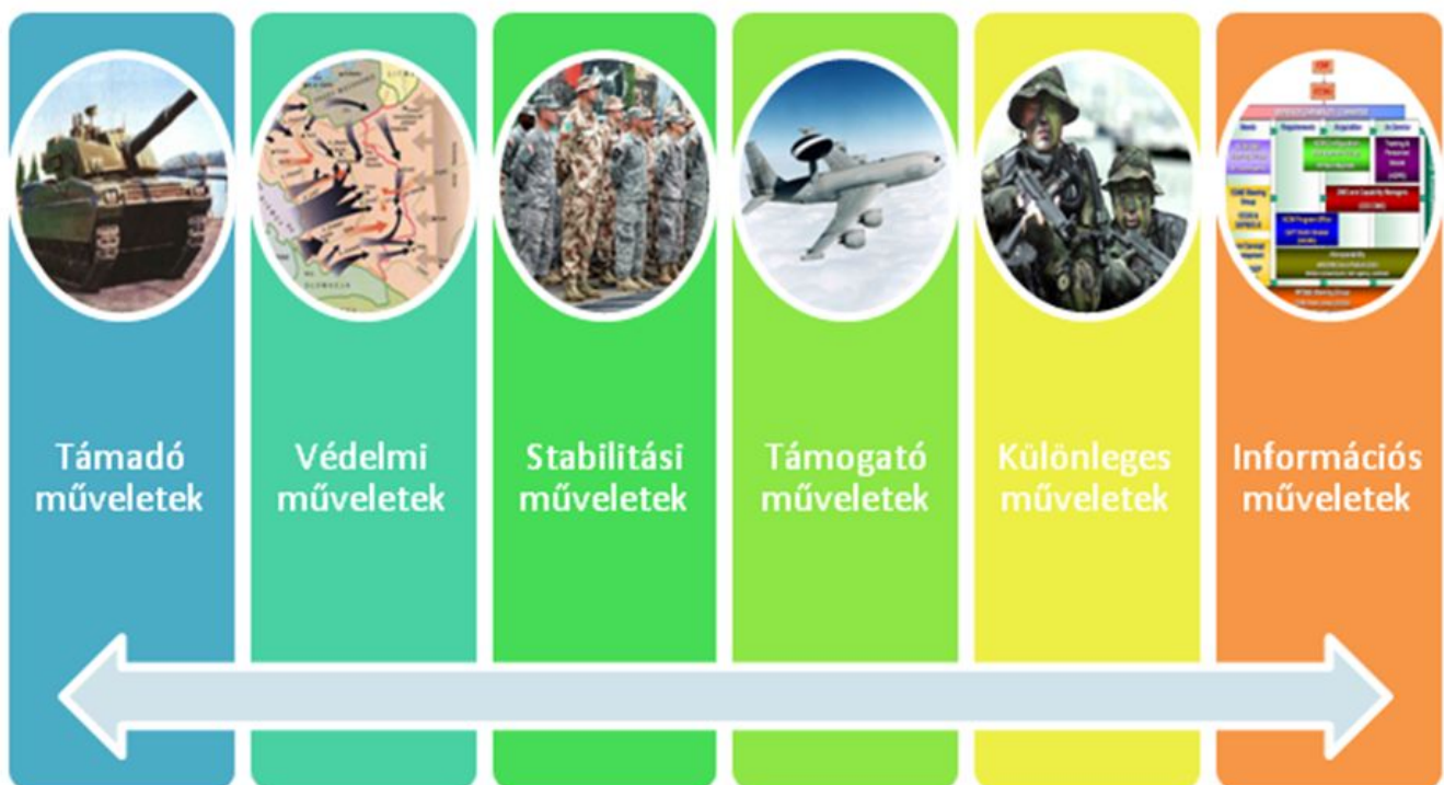
3. sz. ábra A hadműveletek típusai

A fontosabb tartalmi kérdések közül ki szeretnék emelni néhány, a hadművelet-elmélet és harcászat témakörének legfontosabb elemeiből. Az első ilyen a műveletek felosztása, tipizálása. (3. sz. ábra) Jól érzékelhető, hogy az elsődleges műveleti felosztásban, eltértek a "szokásos" légi-, felszíni műveleti (szárazföldi, tengeri) kategorizálástól.