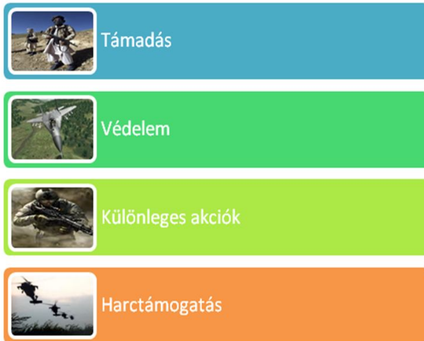
4. sz. ábra A harci műveletek típusai (Forrás: Military Doctrine, 53. p.)