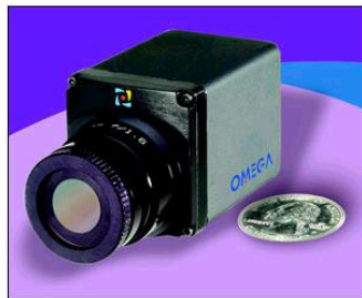
3. ábra. Mini UAV hasznos terheként alkalmazható infra kamera [6]

Az elektro-optikai felderítésre bevetett kis méretű UAV-k leggyakrabban nagy látószögű fix vagy állítható zoommal rendelkező digitális kamerával, esetleg fényképezőgéppel, vagy infra kamerával (3. ábra) vannak ellátva. A méret és súlykorlátozás miatt ezen eszközök közül többnyire csak egy van a légi egységre szerelve. Természetesen ezek a szenzorok modul jellegűek. Bevetés előtt a katonának lehetősége van kiválasztani a szükséges szenzort, és azt az UAV-hez csatlakoztatni.