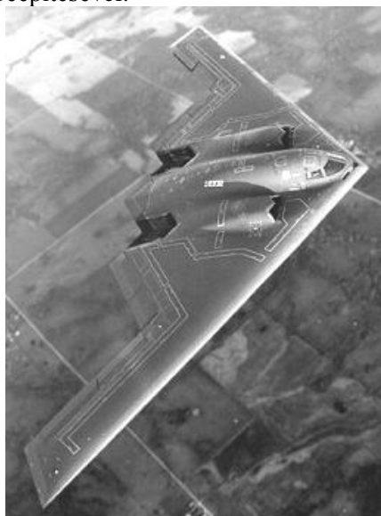
3. ábra. B-2A Spirit nehézbombázó

A történelemben ez volt az első alkalom, hogy egyszerre tevékenykedtek egy hadszíntéren a régmúlt ( B-52H ), a közelmúlt ( B-1B ) és a jövő ( B-2A ) nehézbombázói. A Spirit bombázók mintegy 500 GBU-31 JDAM 3 eszközt vetettek be, ami nagyjából 11%-a volt az összes bevetett hadianyagnak. Az előbbi fegyverek lényegében az Öböl-háborúban már alkalmazott hasonló jellegű bombák továbbfejlesztett változatai, amelyek irányítási rendszerei továbbtökéletesedtek a GPS navigációs egységek beépítésével.