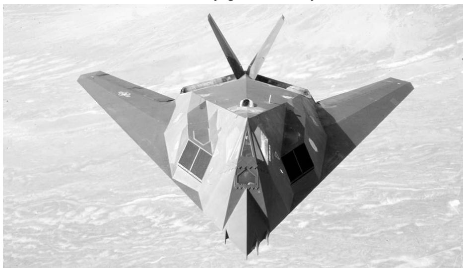
2. ábra. F-117A Nighthawk típusú bombázó repülőgép

A lopakodó F-117A gépeknek (2. ábra) ez már a második bevetése volt. Egy évvel az Öböl-háború előtt Panamában már bevetették az új bombázókat, de azok akkor elvették a megjelölt célok túlnyomó többségét. A lehetséges hibákat nem publikálták, de mindenesetre sikerült azokat kiküszöbölni, hiszen az Irak elleni hadműveletekben már lényegesen hatékonyabban működtek.