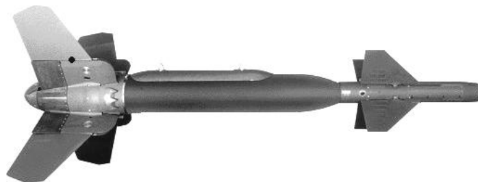
1. ábra. Lézerirányítású bomba

Szintén ebben az időszakban jelentek meg az amerikai hadsereg által alkalmazott lézerirányítású bombák (1. ábra).