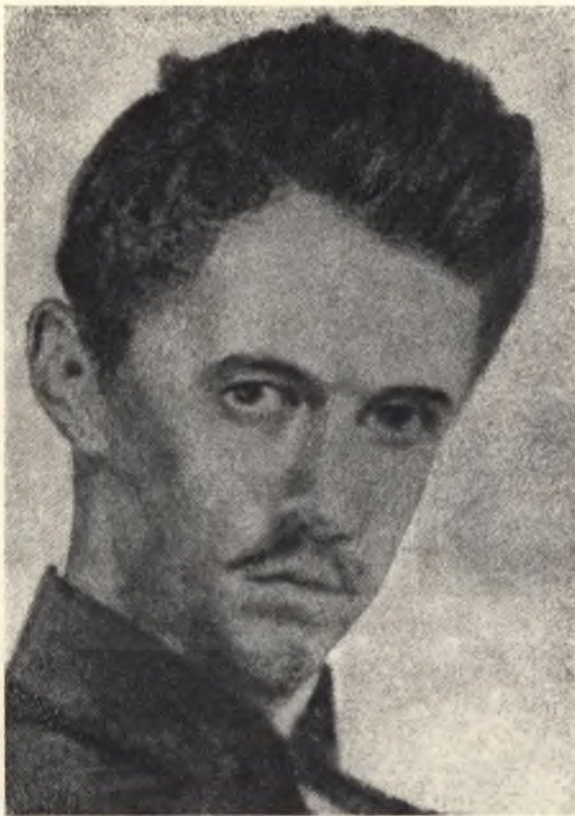
Alexander Petöfi im Jahre 1847. Einziges erhaltenes Daguerrotyp des Dichters