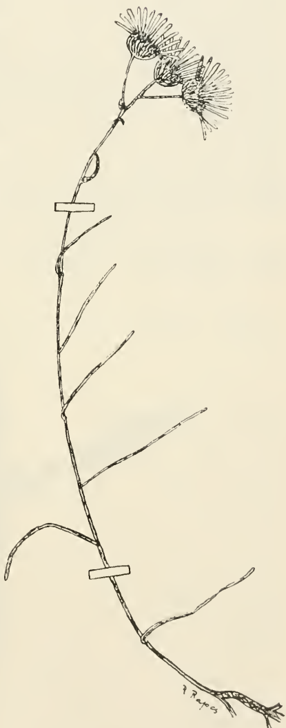
59. rajz. Aster depressus Kit. (Szolnok 1903.)

A tengerparti növények általában pozsgásak ( succulens ) és eme tulajdonságukat más talajon elvesztik, levelük apróbb lesz.