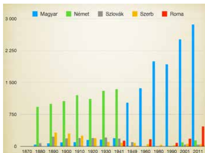
2. ábra: Csobánka etnikai összetétele 1870 és 2011 között (KSH népszámlálási adatok)

A 12330/1945 számú miniszterelnöki rendelet 1945. december 29-én a német nemzetiségűek kitelepítéséről és a vagyonuk zárolásáról határozott. A faluban 1946. februárban kezdték összeírni és kihirdetni a kitelepítendő családok neveét, majd március 15-én indították el az első transzportot Németországba. A kitelepítés során elsőként 650 főt vittek Heidenheimbe, majd néhány nappal később, március 19-én 660 főt Wertheimbe. A község lényegében kiürült, a lakosság 75%-át, 1310 főt hurcoltak el (Leikep, in: Padisák, 2011: 31–34).