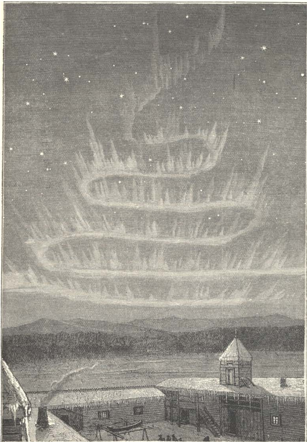
1. ábra. Sarki fény, melyet Alaskában 1868 december 27-ikén Whymper figyelt meg.