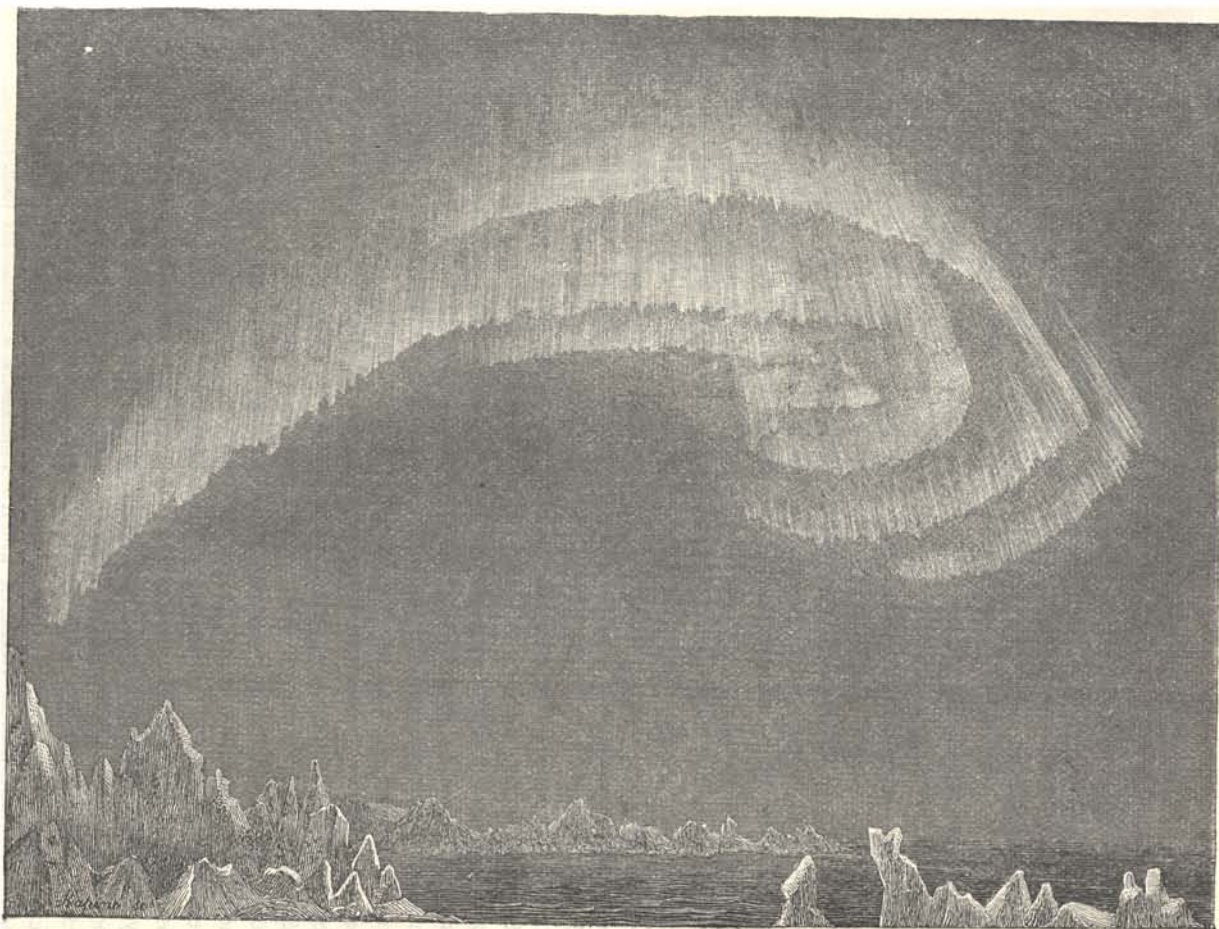
2. ábra. Sarki fény a déli szemhatáron, melyet Bossekopban figyeltek meg.