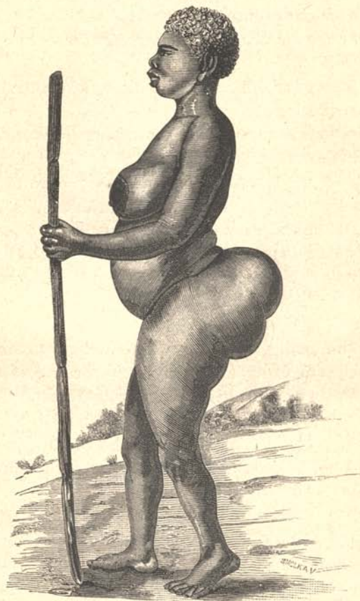
3-ik ábra. Busman nő.

— A nagy farról Topinard azt jegyzé meg, hogy az esetről esetre mindenütt előfordúl, de leggyakrabban Afrika négereinél. — Ezt nem is tekintve, Dr. Houzé állítása, a nőknek eme supponált kiváltságára nézve, már azért sem bírhat alappal, mert ő elfelejtette bonczolat útján bebizonyítani, hogy vajjon a nagy far csakugyan együttjár-e a harmadik tompor jelenlétével. Már pedig ezen