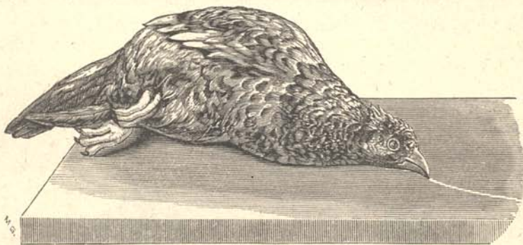
I-ső ábra. Hipnózisban levő tyúk.

a legjobban dühöngött és a legbadarabb magyarázatokra adott alkalmat, tétetett le a hipnotizmus tudományos értelmezésének első kísérleti alapköve. Ebben az időben élt ugyanis Rómában (1646) Kircher Athanasius jezsuita atya, tanár a collegium romanumban, ki »Ars magna lucis et umbrae« című könyvének »De imaginatione gallinae« feliratú fejezetében a következő kísérletet írja le: »Ha egy tyúknak a lábait összekötjük és azután letesszük a padlóra, szárnyaival egy ideig ide-oda vergődni és hánykolódni fog, hogy a lábaira kötött huroktól ily módon megszabaduljon. Pár perczig tartó haszontalan vergődés után egyszerre megnyugszik. Míg a tyúk csendesen fekszik, huzzunk krétával szemével egy irányban egy hosszú vonást, oldjuk fel a tyúk kötelékét, és ez, daczára annak, hogy már nincs megkötve, még sem fog odább szaladni még akkor sem, ha a felkelésre nógatjuk is«. A tudós