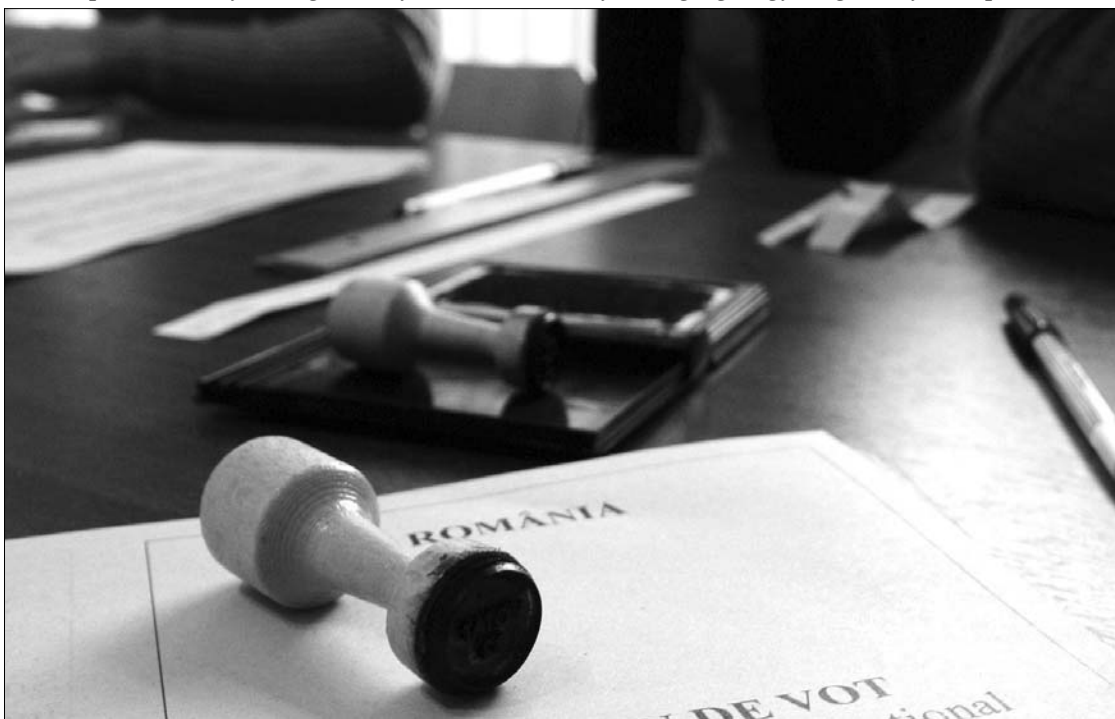
A hazai választópolgár jövő ilyenkor hat szavazócédulát kap majd, mielőtt a szavazófülkébe lép

Elégedett a kompromisszummal Markó Béla kormányfő-helyettes is. Az Erdélyi Televízióknak elmondta: az új választási rendszer biztosítja majd a romániai magyarság arányos képviselését azáltal, hogy a képviselők nagyobb része egyéni körzetekből, kisebb hányada pedig országos listáról kerül majd be a parlamentbe. „Persze, az ördög a részletekben rejtőzik, hisz ezután kell majd kidolgozni a törvénytervezeteket” – mondta a politikus. ◀