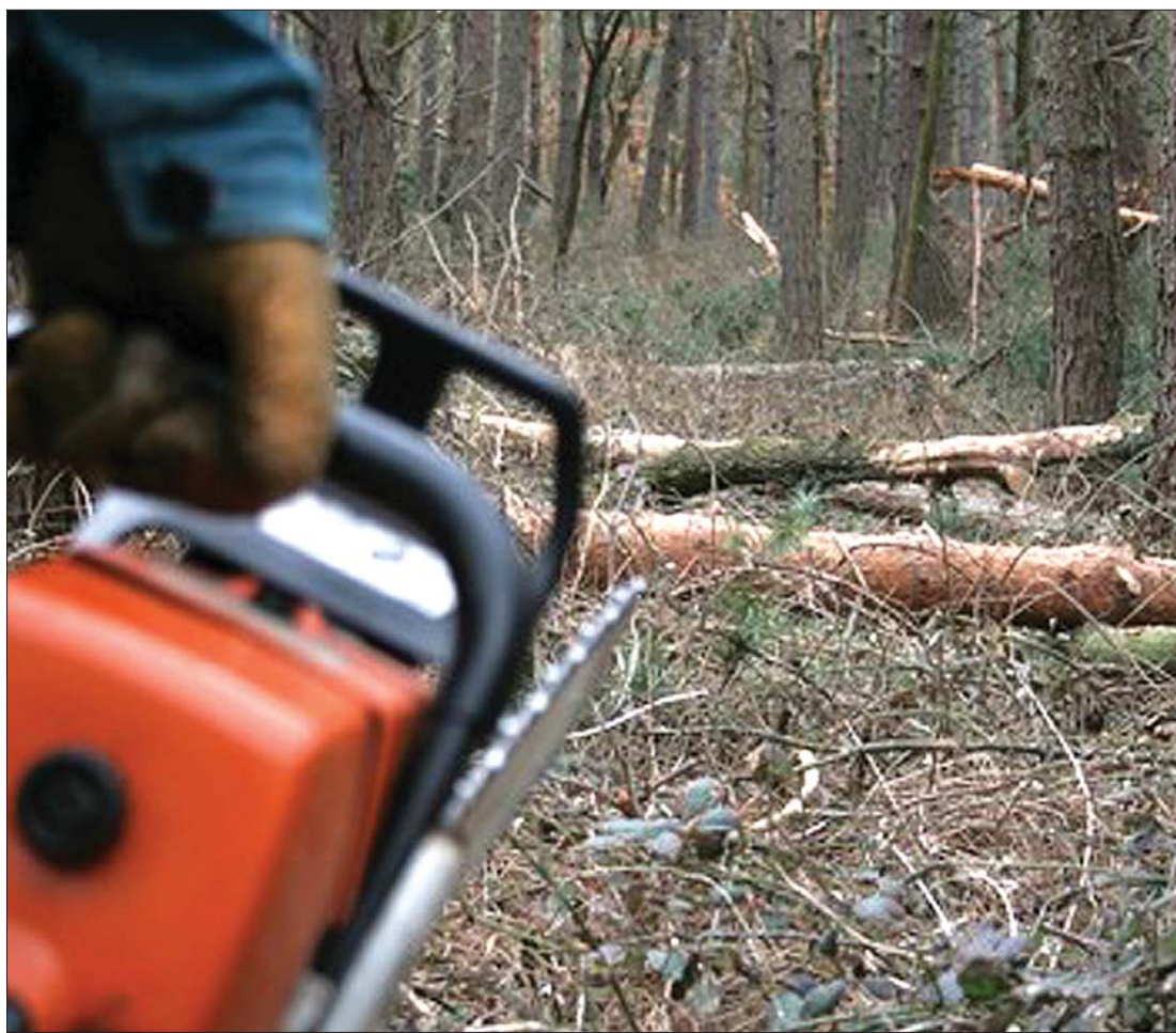
A romániai erdőket szemrebbelés nélkül dézsmálják a fatolvajok, a törvény szigora azonban százból csak egyet ér utol

▶ Míg a Környezetvédelmi és Erdészeti Minisztérium a jelenleginél szigorúbb törvényekkel venné fel a fatolvajlás elleni harcot, a Természetvédelmi Világszervezet (WWF) pedig