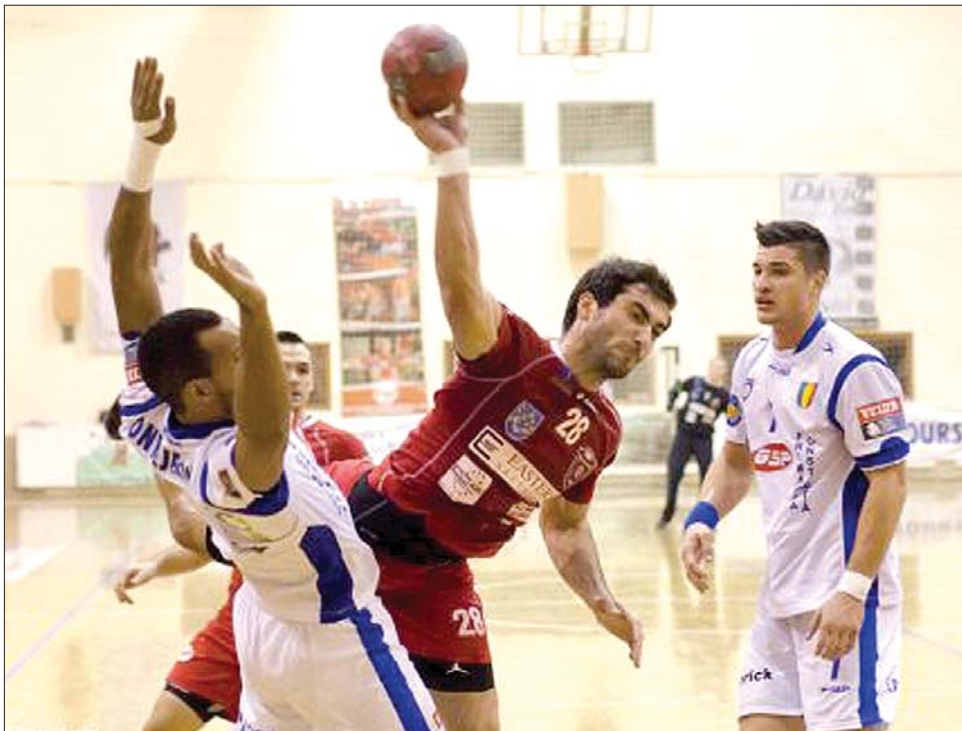
▶ Az udvarhelyiek (bordó mez) három bajnoki mérkőzéssel készülnek az európai kupamérkőzéseikre

Nyolc forduló után is pontvesztés nélkül, a konstancaiak vezetnek a bajnokságban, a 9 pontos udvarhelyi csapatot pedig a Bákó (14 pont), a Călărăși