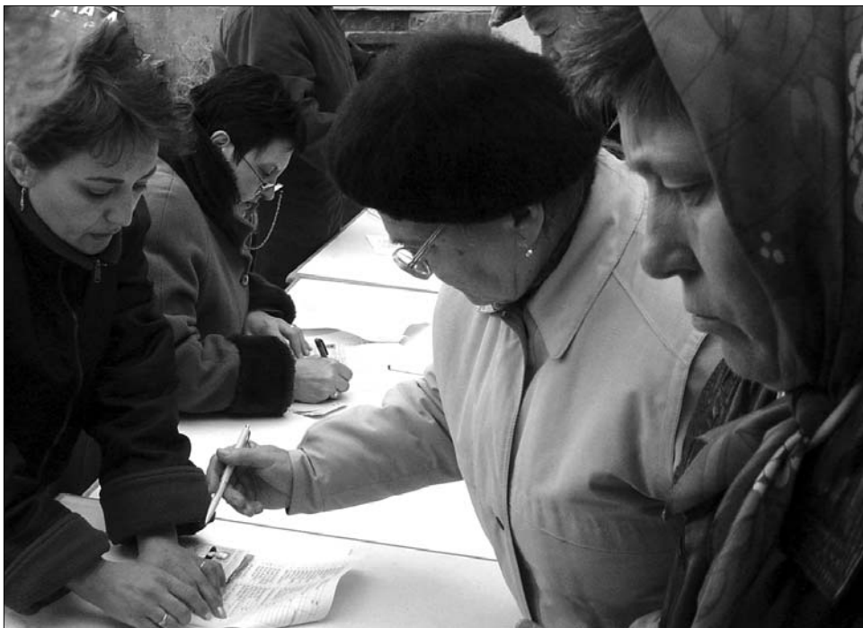
Becslések szerint idén megkétszereződött a fűtéspótlékért folyamodók száma a városházákon

Kovácsna megyében november 20. után a szociális iroda alkalmazottai felkeresik a fűtéstámogatást igénylő családok jelentős részét, és megvizsgálják, hogy megalapozottan kértek-e támogatást. A segélykérők tulajdonában lévő autók, lakások és állatok nyilvántartásáról az adóhivataloknál és a gazda-