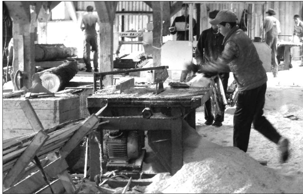
„Nem tudunk annyit kitermelni, hogy a gatteros ne venné meg” – mondják a fát vágó gyimesiek

A falopások mögött azonban sokkal szervezettebb bűnözést sejtteni – amiről az erre illetékes erdészek és rend-