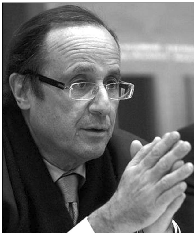
Francois Hollande, a francia szocialisták államfő-jelöltje. Elnökként is „mindennapi ember” maradna

Pierre Moscovici szocialista politikus például maga is fontolgatta annak lehetőségét, hogy megméretteti magát, végül azonban feladta a tervet. Szerinte ugyanis ahhoz, hogy az ember részt vegyen egy ilyen versenyben, „egyfajta örületre, a narcizmus valamilyen formájára, különleges belső hajtóerőre van szükség”. A jelöltnek számolnia kell azzal, hogy szüntelenül reá irányul a figyelem, vállalnia kell megannyi valótlanítást, eközben pedig mindig meg kell őriznie a vonzerejét. Jean-Louis Borloo centrista politikus a kormánytöbbségben belül Nicolas Sarkozy elnök egyik potenciális kihívójának számított, végül már a kampány startja előtt letett arról. Cécile Duflot zöld jelölt el sem indult pártján be-