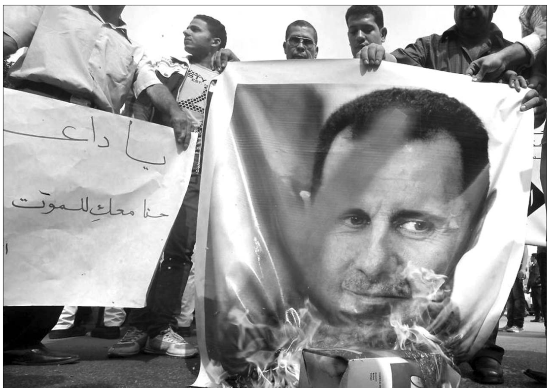
Bassár al-Aszad elnök rendszere elfojtja a tüntetéseket. Az Arab Liga nem mutat türelmet az országgal szemben

Az Arab Liga rendkívüli csúcstalálkozójának összehívását követelte Damaszkusz, hogy időt nyerjen, és megakadályozza tagságának felfüggesztését a szervezetben. Az Arab Liga szombaton döntött úgy, hogy holnaptól felfüggeszti Szíria tagságát, mert Damaszkusz nem hajlja végre a páranab szervezet megbékélési tervét; egyúttal felszólította a szíriai hadsereget, hogy vessen véget