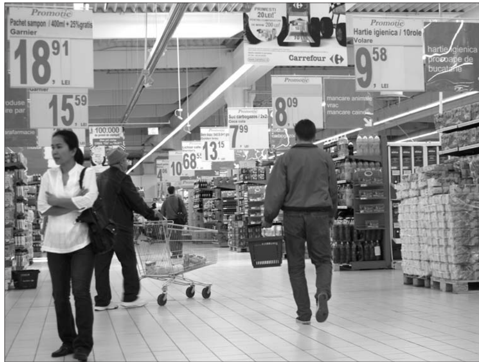
Sokan olajat és lisztet vásárolnak, kevesebb fogy a kész és a félkész termékekből