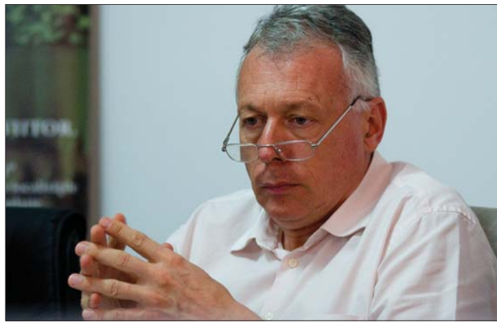
Borbély László miniszter, az RMDSZ új politikai alelnöke

kusnak megvan a szabadsága saját személyére szabni a feladatot. Borbély Lászlóra mintha ráöntötték volna ezt az új ruhát. 4. oldal ▶