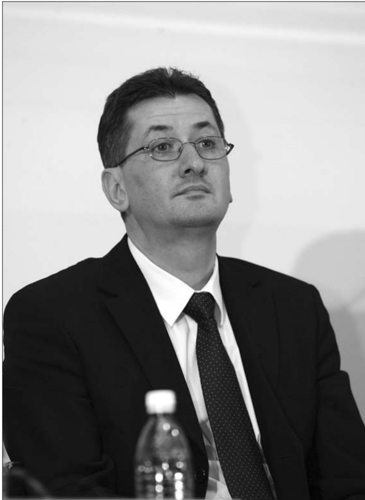
Nicolae Ivăşchescu államtitkár veszi át ideiglenesen Ioan Botiş helyét

„Lemondásom hátterében erkölcsi indokok állnak. Úgy gondolom, hogy becsületbeli kötelességem ezt megtenni. Bocsanatot