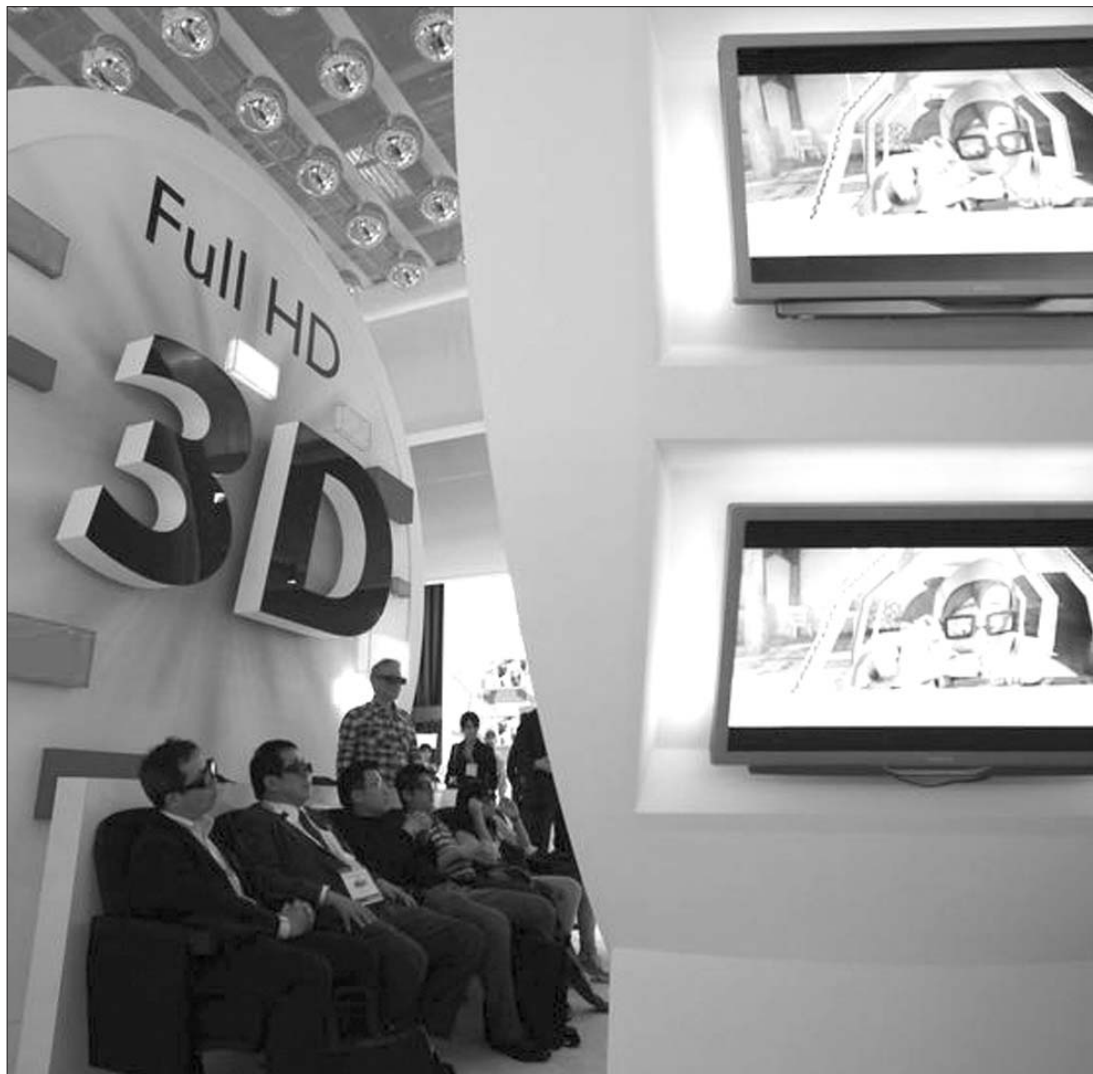
A 3D-s képsorok a moziötétből a tévékészülékekbe költöztek, bár az ár miatt Romániában viszonylag kevesen vevők rá

es Sex and Zen 3D-s folytatását, amely 2,78 millió hongkongi dollárt (357 ezer amerikai dollár) termelt az első napon, amely lekörözte az Avatar -t is – írja a The Hollywood Reporter re hivatkozva a Mediafax . A Sex and Zen folytatásával ellentétben James Cameron nagysikerű Avatar -ja „csak” 2,5 millió hongkongi dollárt hozott az első napon. „Nem járok gyakran moziba, de ez túl jónak hangzik ahhoz, hogy csak úgy kihagyjam. Egyszerűen látni akarom, hogy a vásznon milyen a pornó 3D-ben” – nyilatkozta egy néző a Fox News nak. ◀