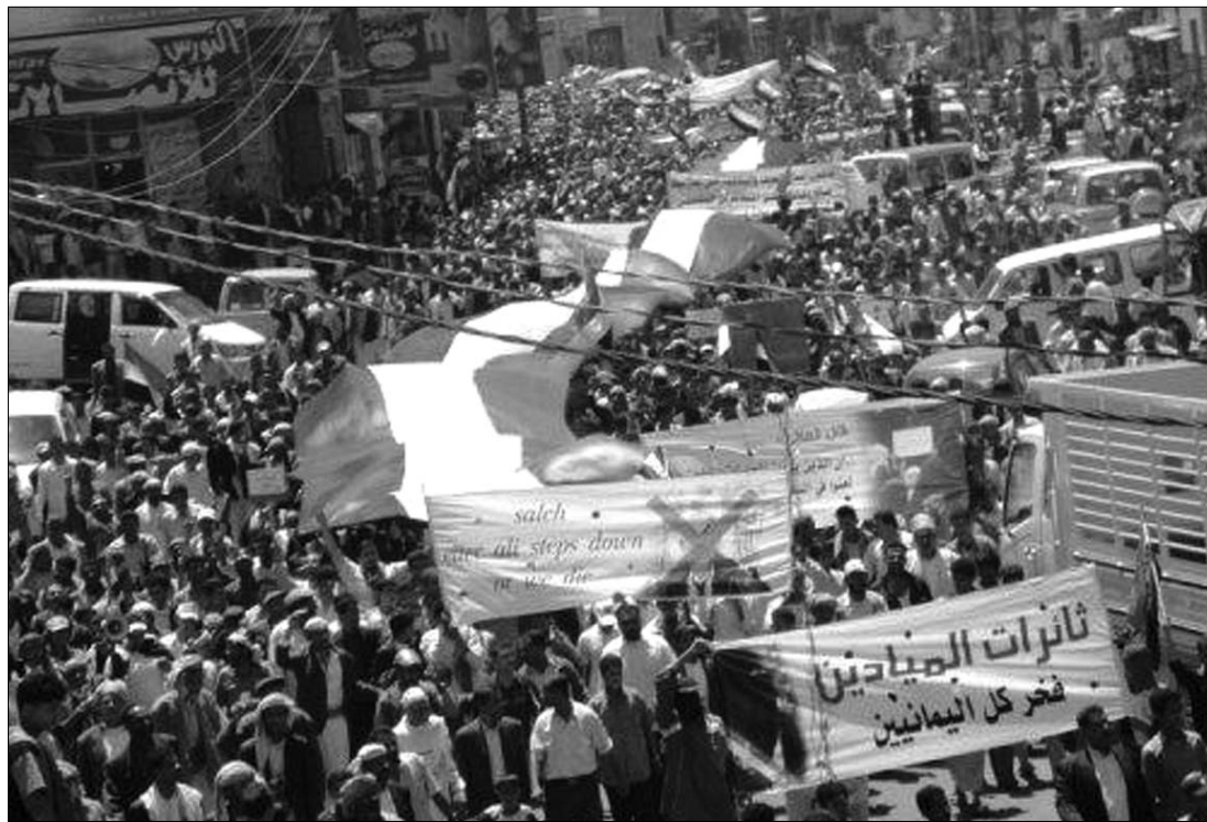
Mindennappossá vált jelenet az arab világ országaiban. Jemenben vérbe fojtják a tiltakozó megmozdulásokat

biztosa. Navi Pillay szerint jelentés érkezett arról, hogy Miszráta ostroma során állítólag kazettás bomba robbant közel a város kórházához. Más híradások szerint két klinikát aknavető, illetve orvlövészek vettek tűz alá. ◀