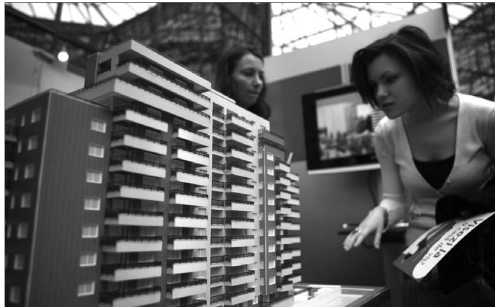
A vásárlás komolyabb tartalékok nélkül nagyon kockázatos – figyelmeztetnek a szakértők

► Már áprilistól életbe léphet a Valeriu Tăbără mezőgazdasági miniszter által kezdeményezett törvény, mely büntetné a parlagon hagyott földek tulajdonosait – közölte az incont.ro . A tárca vezetője szerint a két hónapja elkészült tervezet szövegét már eljuttatták Emil Boc miniszterelnöknek, február elsejétől pedig nyilvános vitára bocsátják. Bár az agrártárca illetékesei korábban úgy nyilatkoztak: a büntetés mértékét a hektáronkénti állami támogatás összegének megfelelően határozzák meg, a jelenlegi dokumentum 400 lejes pénzbírságról beszél. A szakértő adatai szerint tavaly 9,4 millió hektár megművelhető földterületből 2,9 millió hektár maradt megművelatlanul. A parlagon maradt földek aránya az utóbbi években folyamatosan növekedett, 2007 óta szinte megduplázódott. Tăbără korábban azt is kilátásba helyezte, hogy pénzzel ösztönöznék azokat, akik földjeiket hosszabb időre bérbe adják: ők az európai uniós támogatások függvényében juthatnak támogatásokhoz. Az agrárminisztérium illetékesei a megművelt területek gyarapodását remélik ettől az intézkedéstől. ◀