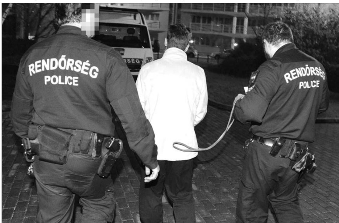
A rendőrök elvezetik az egyik gyanúsítottat. A halott lányok egyike kábítószer hatása alatt állt

Az egyik halálra nyomott lány vérében kábítószerrel találtak, tehát már ezért sem ismerhette fel a veszélyt. A kábítószer amfetaminszármazék volt. A rendőrök vették észre, hogy a szórakozóhely előtt a téren három test fekszik, körülöttük biztonsági emberek. A belügyminiszter szerint a rendőrök és a mentők is példás gyorsasággal intézkedtek: rövid időn belül 111 rendőr és 28 bünyügyi munkatárs érkezett a helyszínre. ◀