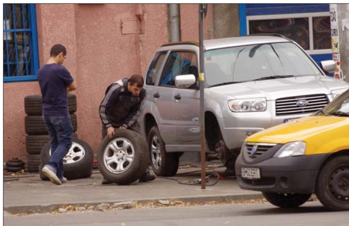
Az abroncsforgalmazók is üzletük fellendülését remélik.

▶ A jelek szerint mégsem mentesülnek az autósok a kötelező téligumi-használatról: a szállításiügyi minisztérium újra napirendre tűzte az erre vonatkozó törvényjavaslatot. Az intézkedés nyertese az államkassza, mely az abroncsok eladásából származó áfa révén 445 millió eurós bevételre tenne szert. 6. oldal ▶