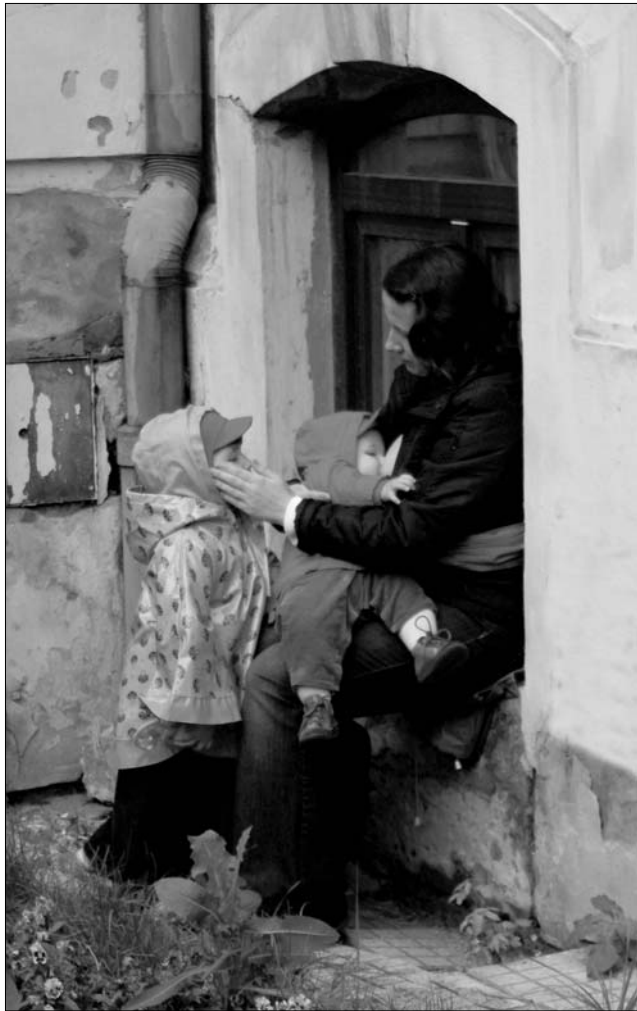
Egyre kevesebb a sokgyermekes család Romániában.