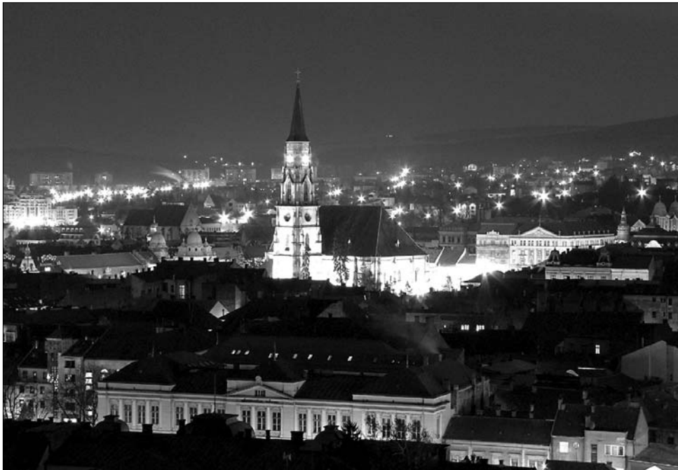
A kincses város 2020-ban talán nemcsak Erdély, hanem egész Európa fővárosa lesz