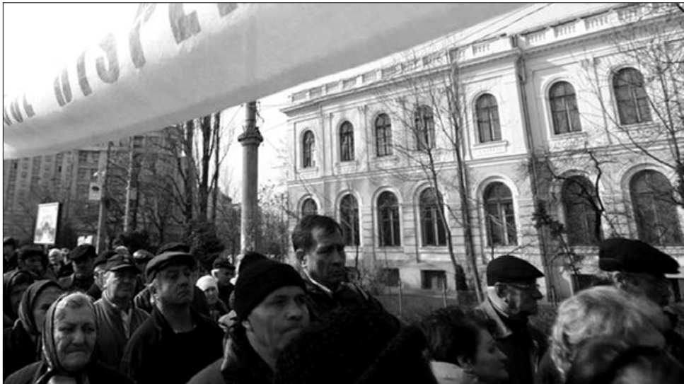
A tartalékos katonák és belügyi alkalmazottak a nyugdíjaik csökkentése ellen tüntettek.

alázó” helyzetbe hozza a nyugállományban lévő rendőröket és katonákat. Az érvényben lévő jogszabály megszünteti a kiemelt járandóságokat, és a befizetett járulékok alapján határozza meg a nyugdíj értékét. Az érdekvédelmi szervezetek arra figyelmeztetnek, a konstancai megmozdulás nem egyedi eset, hamarosan országos tiltakozó akciókra kerül sor. Legközelebb Bukarestben, január 24-én vonulnak fel azok az érintettek, akik nem értenek egyet a kormány szigorító intézkedéseivel. ◀