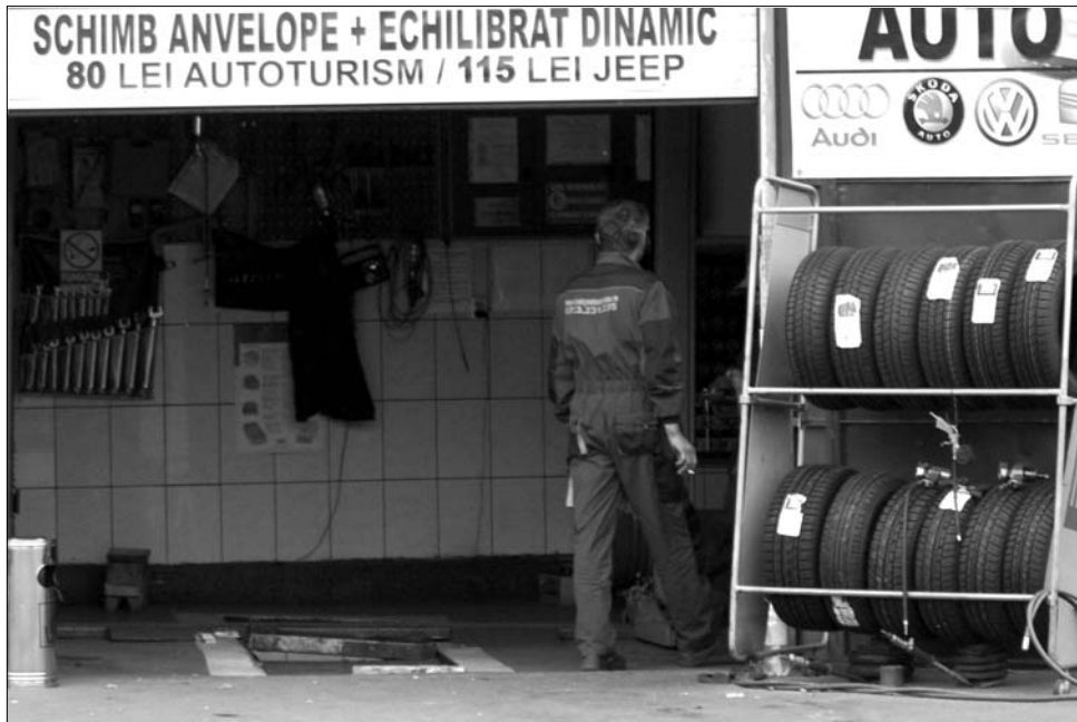
Nemcsak az autók biztonságát szolgálja a téli gumi: az államkassza bevételeit is „védné”

Romániában jelenleg mintegy 5,38 millió autó van bejegyezve, melyből 1,1 millió speciális jármű, mely nem igényel külön téli felszerelést, hetvenezer pedig az állami gépkocsipark tulajdona – részletezi a hivatalos szöveg. A fennmaradó 4,21 millió autó téli gumival való ellátása 1,85 milliárd euróba kerülne, mely a ráeső TVA kifizetése után közel félmilliárdos nyereséget termelne a költségvetés számára. (Ugyanakkor értékes adójeleket is elvonna a büdzséből, mivel a