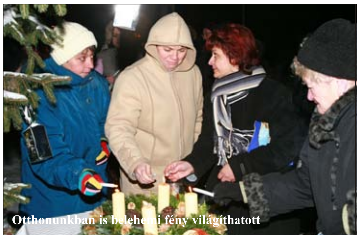
Otthonunkban is betlehemi fény világíthatott