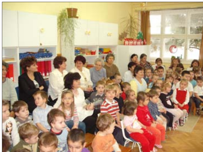
Együtt ünnepeltünk a nyugdíjasokkal és a bölcsisekkel