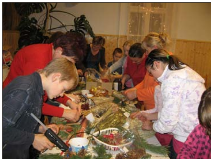
A másik kedvenc: adventi koszorúkészítés

Szomorú voltam, hogy így járt a hiú hóember, de a következő télen ismét találkoztunk, és akkor már boldogan fogadta az első orrot, amit a szeme alá biggyesztettem. És mindketten felneveltünk, hogy milyen buták is a hóemberek!