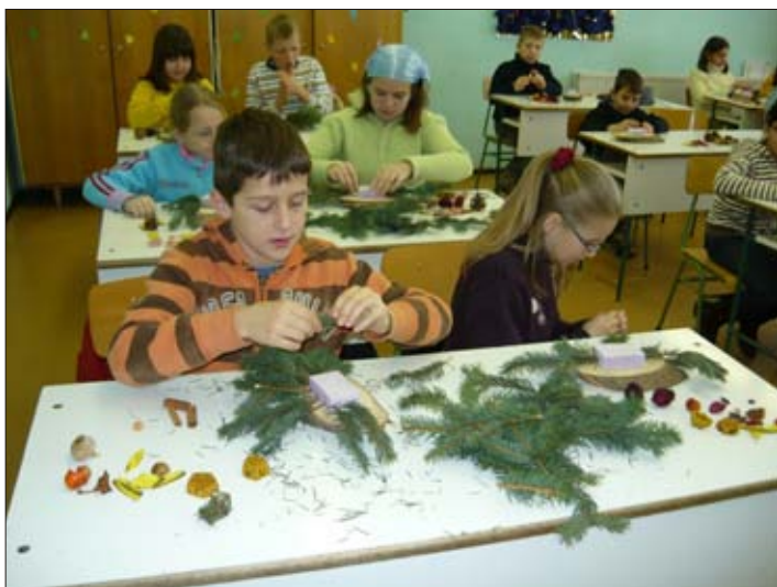
A játszóházban asztali dísz...