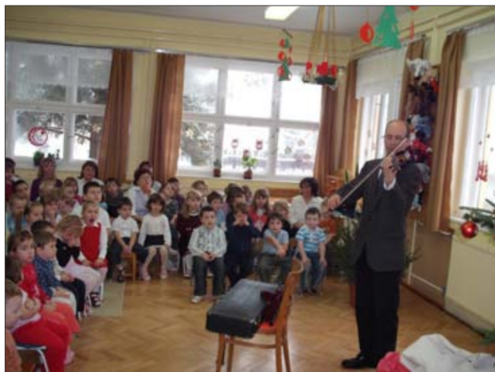
A református lelkész gyönyörű hegedűjátékát hallhattuk

A Békésszentandrási Ipartestület 2010. február 5-én, pénteken 16 órakor