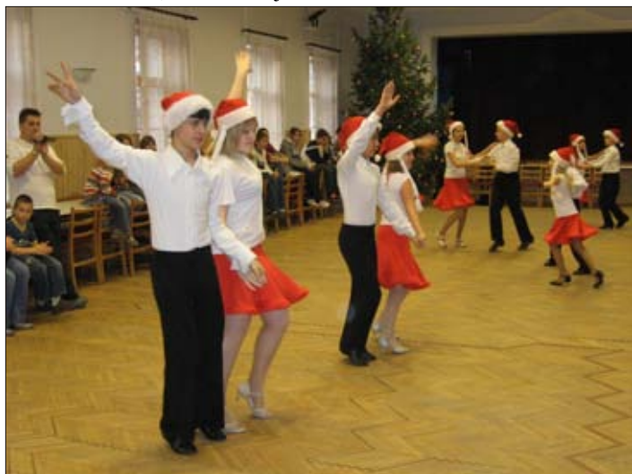
A Vértessy Tánc-Sport Egyesület Mikulás-táncosai