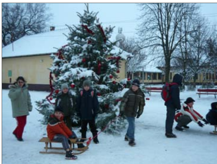
„A Karácsony akkor szép, hogyha fehér hóba lép...”