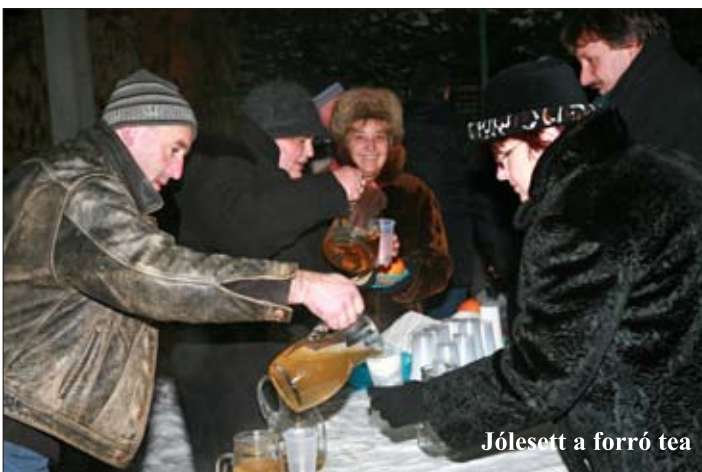
Jólesett a forró tea