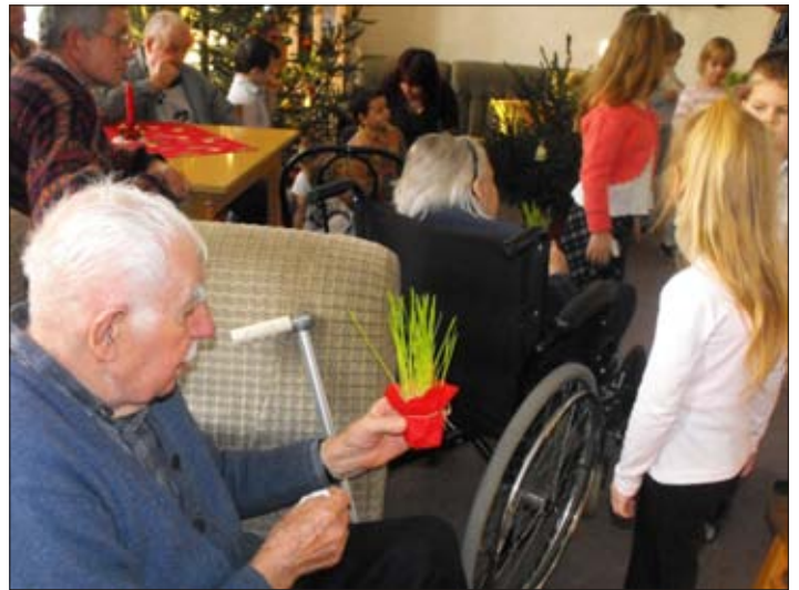
Szent László utcai ovisok karácsonyi műsora, ajándékátadás