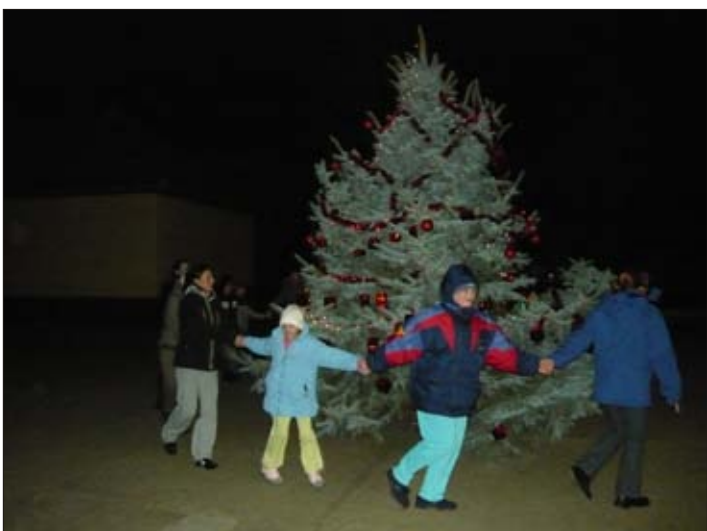
„Sok kis gyermek körbejárja...”