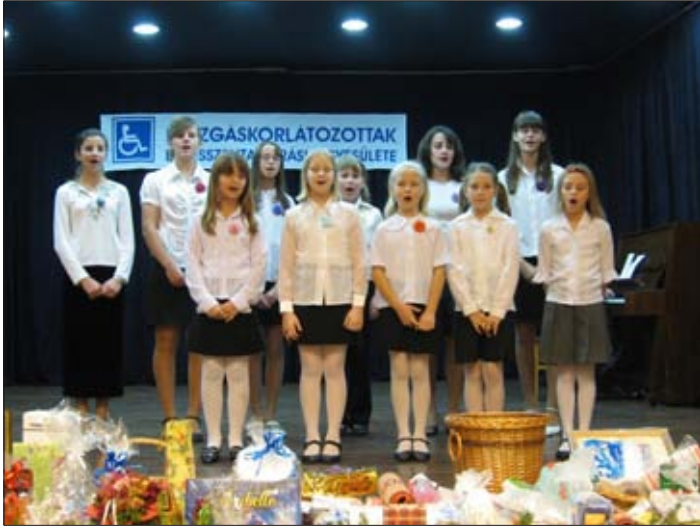
A Hunyadi János Általános Iskola énekkara

A Mozgáskorlátozottak Békésszentandrásai Egyesülete december 12-én du. 2 órától tartotta hagyományos karácsonyi ünnepségét.