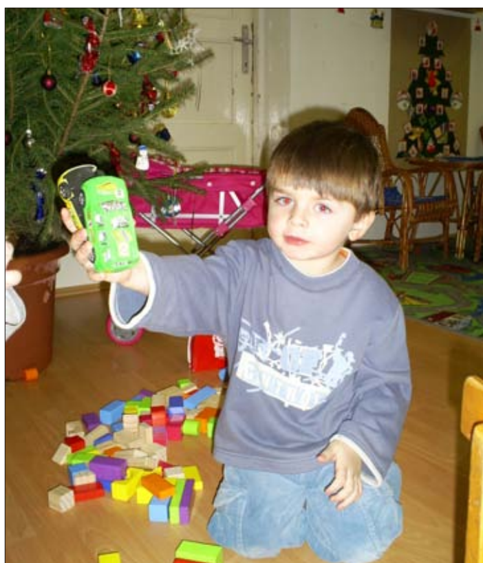
Nézd, milyen szép játékokat kaptunk!