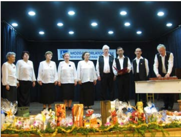
A csorvásiak is nagy sikert arattak