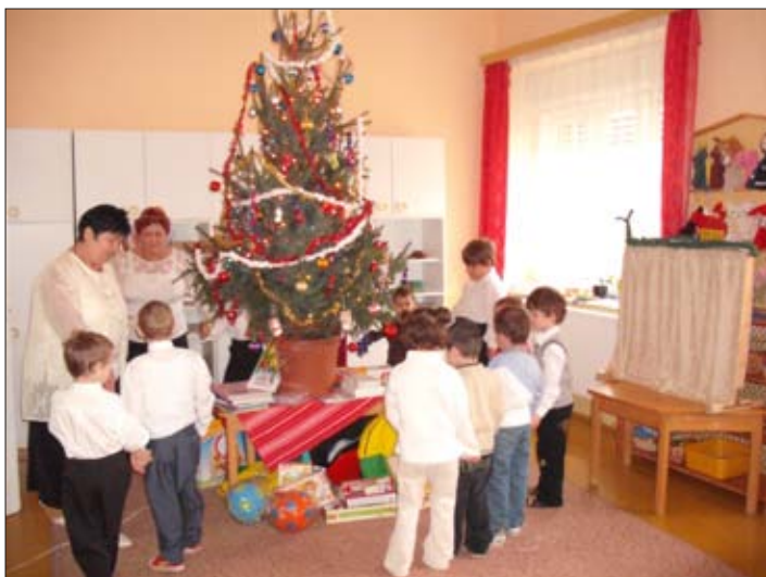
A kisovisok is sok játékot kaptak