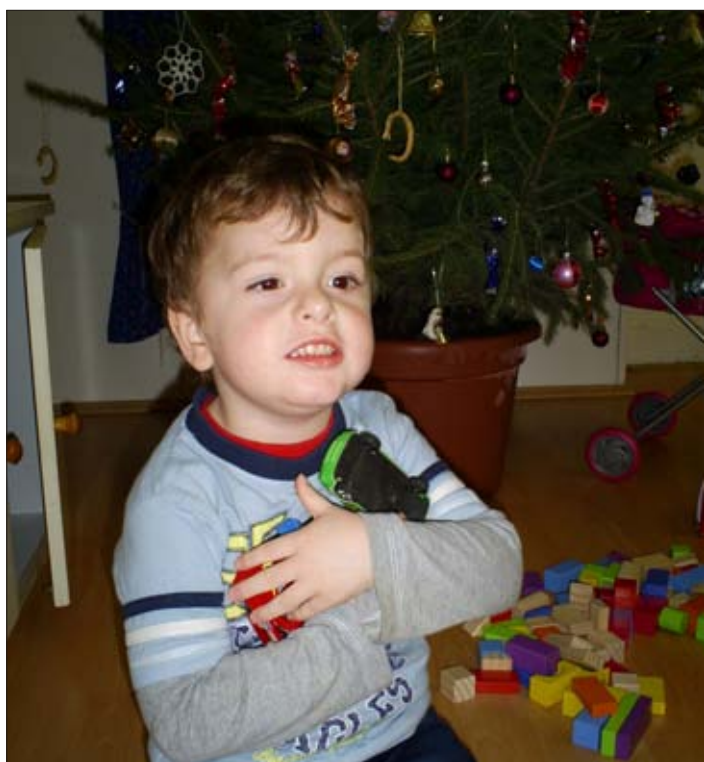
Ez mind az enyém!