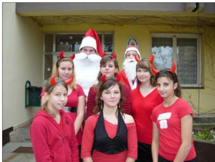
Mikulások és krampuszaik