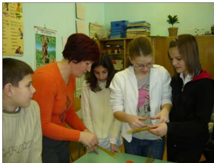
és angyalka készült