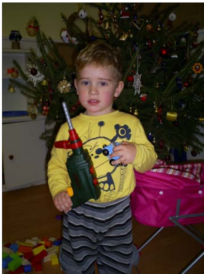
Én mindent meghívítok!