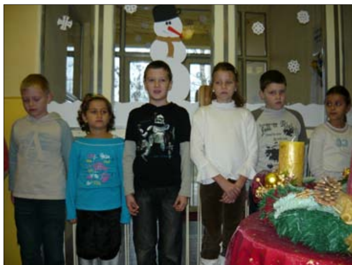
A második osztály és a második Adventi gyertya