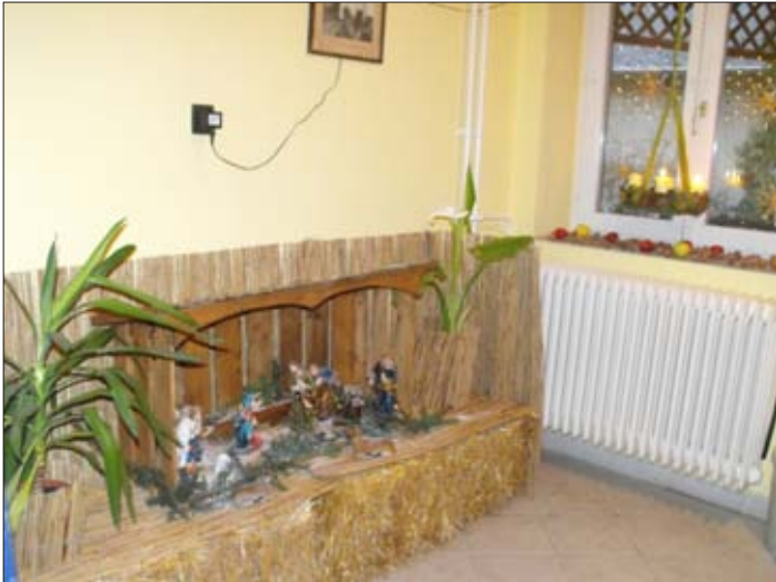
Betlehem az aulában