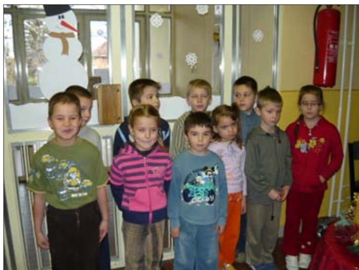
Az első gyertyagyűjtásra várva

Mivel ezeket a programokat már ismerik, hangulatukat személyesen vagy a televízió képernyőjén keresztül megtapasztalhatták következésképpen most egy képes beszámoló a nevezett eseményekről.