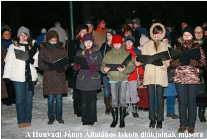
A Hunyadi János Általános Iskola diákjainak műsora

Az ünnepség végén a jelenlévők gyertyát kaptak, és a lángot hazavihették, hogy otthonukban is betlehemi fény világítson.