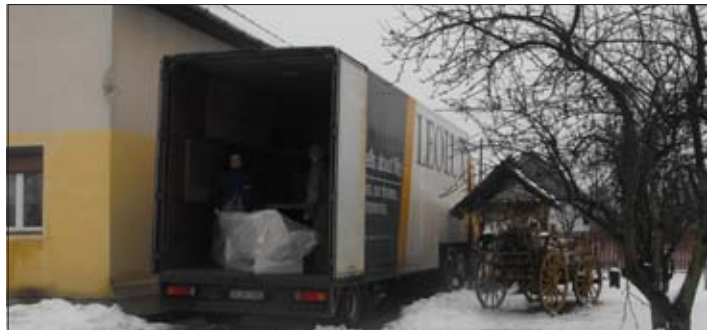
Megérkezett a kamion!