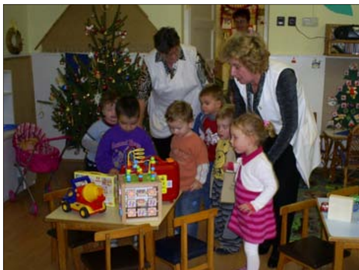
Jujj, itt járt a Jézuska!

Köszönjük a szülőknek és a Képviselő-testület tagjainak ezt, a sok új játékkal gazdaggá tett napot, és az Önkormányzatnak a szép fenyőt! Yetik-Takács Éva