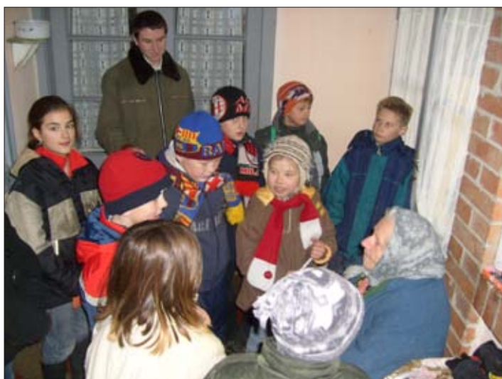
Karácsonyi kántálás hittanosokkal

A Békésszentandrás Kézművesek Egyesülete tisztelettel kéri az adózó állampolgárokat, hogy adjuk 1%-ával támogassák egyesületünk munkáját!