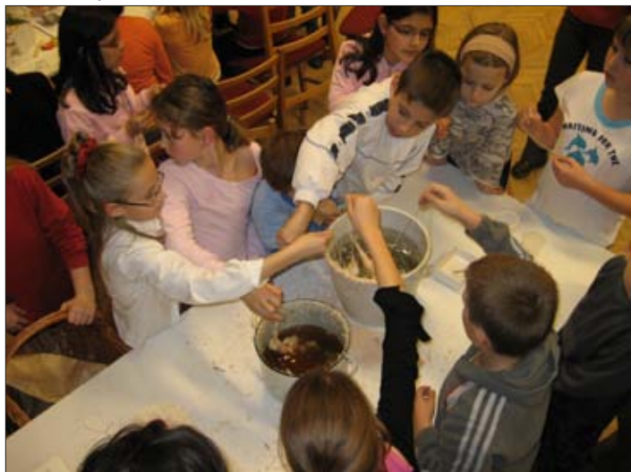
A népszerű gyergyamártás