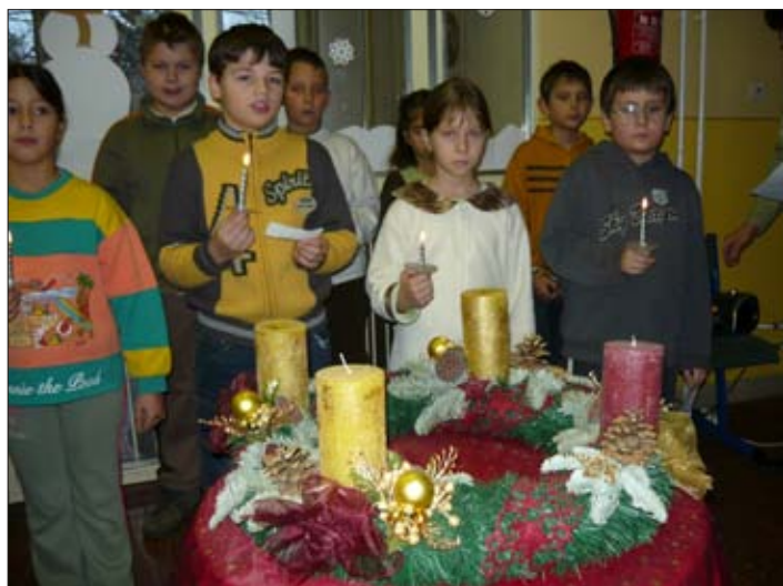
A harmadikosok műsora