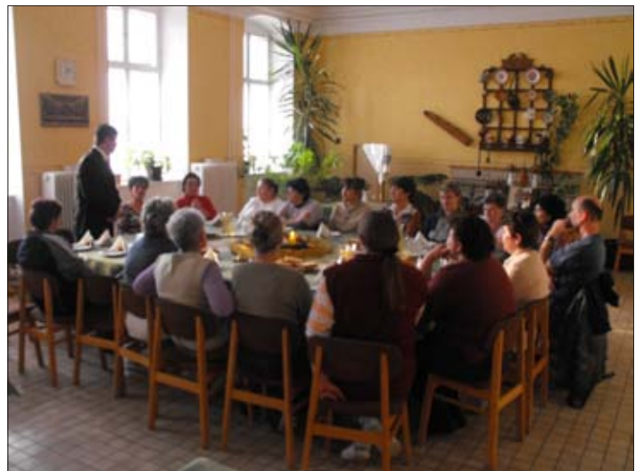
Dolgozók munkahelyi karácsonya

Még egy köszönetet szeretnék az újság hasábjain keresztül tolmácsolni!