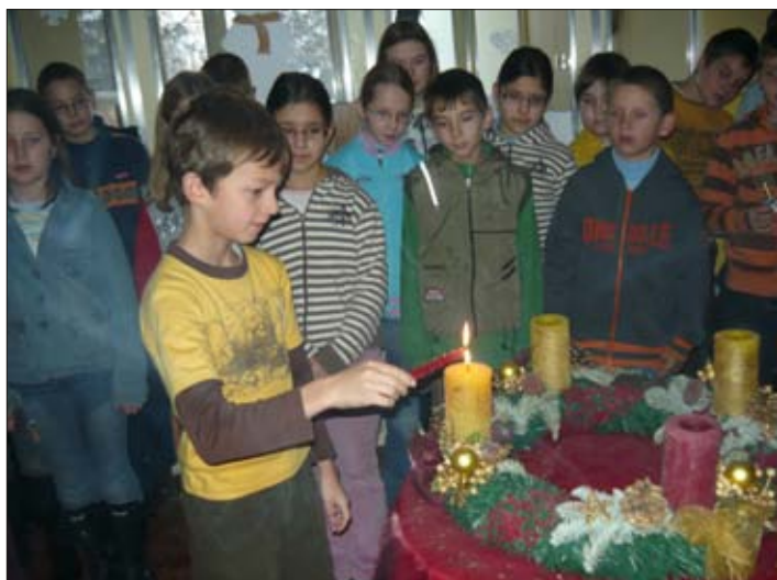
Az utolsó gyertyaláng