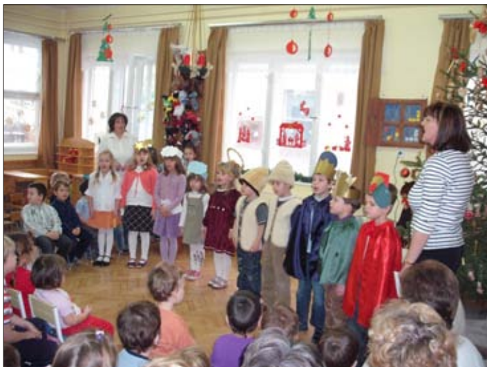
A főszereplők a körtések voltak