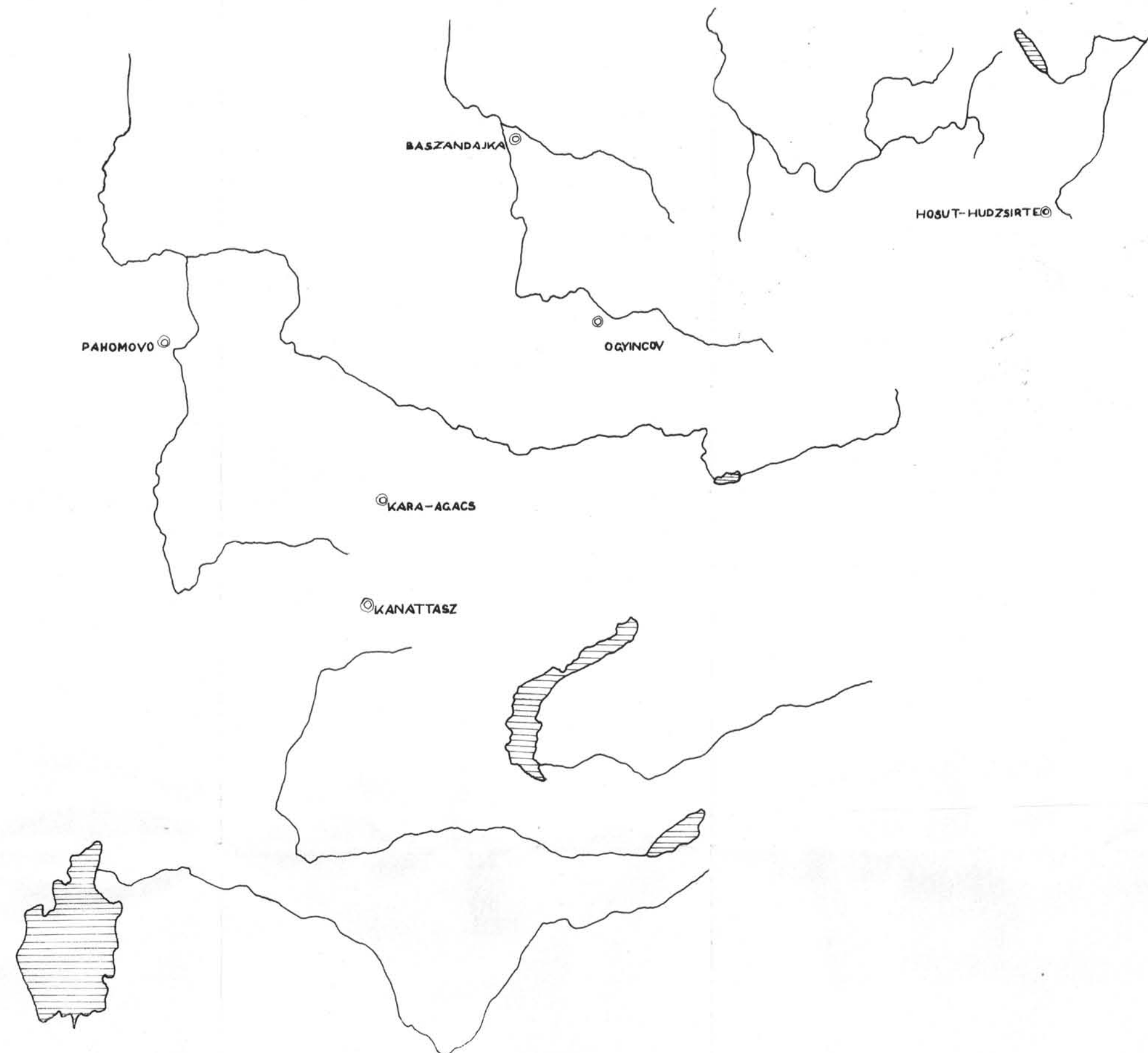
Térképmelléklet: A kelet-európai és dél-szibériai kora középkori részleges lovasmetkezések. — Les tombes à ensevelissement partiel de cheval du Haut Moyen Âge dans l'Europe orientale et dans la Sibirie du Sud