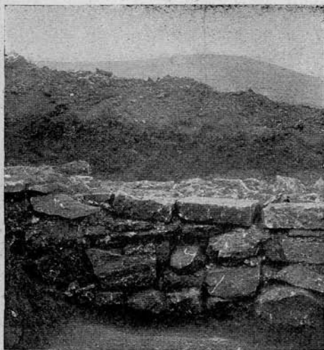
2. kép. „Opus incertum“ a dezmeri rómaikori villa alapfalából.

A mi az egyes helyiségek belvilágát illeti: A = 3\cdot05 \times 12\cdot28 +