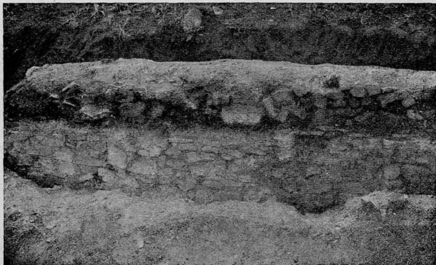
Fig. 33. Mur de soutènement.

Dans cet article, l'auteur s'efforce de démontrer que Porolissum n'e se trouve pas à l'endroit indiqué par Ch. Torma, mais aux environs de la commune actuellement nommée Bethlen . Mais sa tentative est restée stérile, car rien ne vient justifier le bien fondé de son point de départ, qui est le suivant: Dans l'inscription gravée sur borne milliaire, communiquée dans les CIL. III. 1627, se trouvent, aux lignes 10 et 11, les mots: „ a Potaissa Napocae m. p. X. “ Or, d'après lui, cela signifierait „ de Potaissa de Napoca “ et non, comme nous le croyions jusqu'ici, „ de Potaissa vers Napoca “. Mais aucun argument sérieux ne vient à l'appui de cette hypothèse. Il faut donc aussi en rejeter le corollaire qu'il en tire, à savoir que le „ Napoca “ indiqué dans la tabula de Ca-