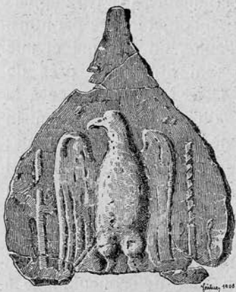
Fig. 38. Plaque d'argent.

Il faut encore mentionner une plaque d'argent en forme de feuille, avec l'image en relief d'un aigle , que nous montrons ici en grandeur naturelle. Cet objet fut trouvé dans la pièce C. Le relief montre un aigle, debout, les ailes étendues, entre deux colonnes, et regardant vers la gauche.