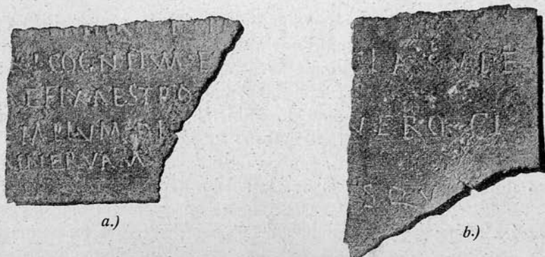
Fig. 37. a—b. Fragment d'un diploma militaire.

avec certitude que les mots f(ilius) et Pa(lmyra?) , rien de plus. Les quatre autres lignes doivent être complétées comme suit :