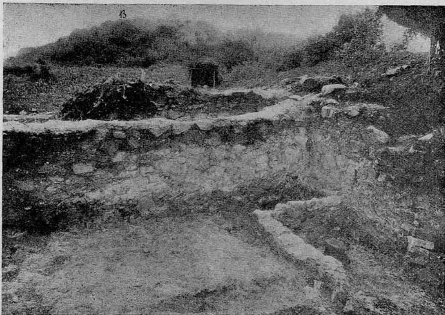
Fig. 36. Restes d'un hypocaustum dans la localité K .

niveaux différents: H est situé à un demi-mètre plus haut que la partie postérieure de E et G , à son tour, est à un niveau d'un demi-mètre plus élevé que celui de H . Il ne peut y avoir de doute, quant à la destination de ces pièces. Dans H nous trouvons les restes du four à pain et du fourneau de cuisine et dans G l'hypocaustum. (Voy. fig. 35.) La partie de cette dernière pièce, qui contenait l'hypocaustum, était pavée de briques, mais il ne reste que peu de chose de ce pavement. Le restant de la pièce était recouvert par un terrazzo de 10 cm. d'épaisseur, de même que la partie de la cuisine non occupée par les fours. Le fourneau de cuisine (à gauche de H ), possède à l'avant une