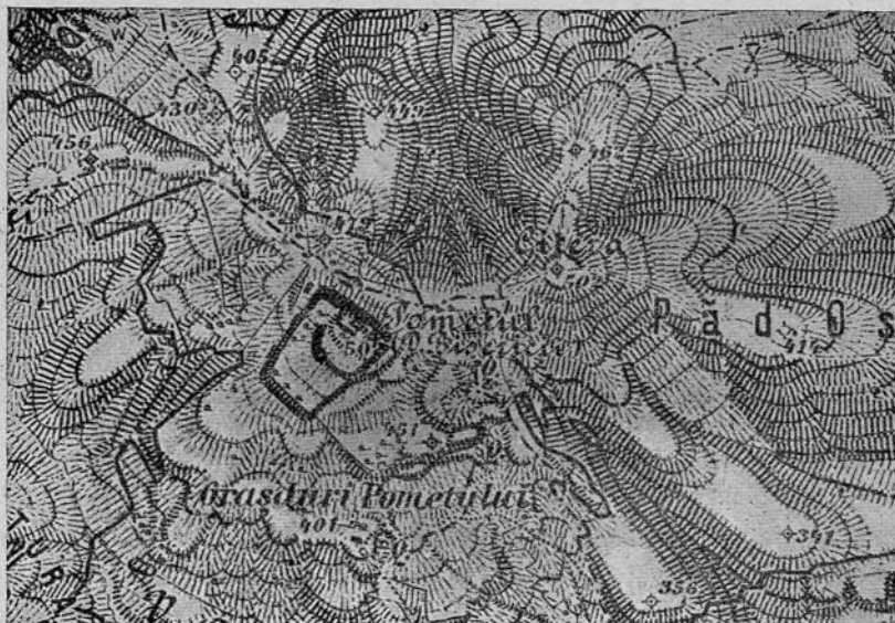
Fig. 32. Plan de Porolissum et ses environs; 1:25,000. On fait des fouilles à peu près aux lettres om de mot Pometul .

Aux confins des communes de Zsákfalva et de Mojgrád, dans le comitat de Szilágy, s'élève, à 502 m. au-dessus du niveau de la mer, la colline nommée Pomet . Les ruines d'un camp romain couvrent le sommet de la colline, et celles d'une ville romaine en recouvrent les flancs. Il y a de cela quarante ans déjà, Charles Torma a découvert que ces ruines étaient les vestiges de la capitale d'une province