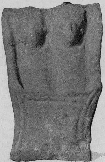
Fig. 39. Relief en terre cuite.

Une autre trouvaille remarquable est un relief en terre cuite, trouvé dans la pièce. Nous possédons plusieurs objets de ce genre dans nos collections ; il en existe de pareils dans d'autres musées de Transylvanie ; en revanche, nous n'avons rien rencontré de semblable dans les musées plus occidentaux. Nous n'en trouvons pas non plus