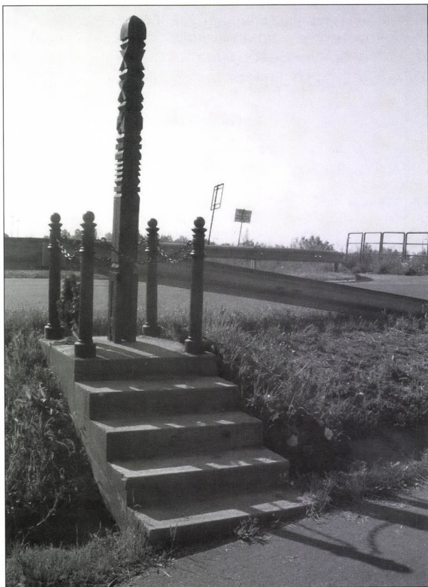
7. kép. Mány Erzsébet és Farkas Mihály emlékoszlopa a Fehér-Körös partján Gyulaváriban