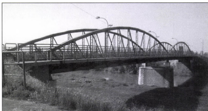
2. kép. A Fehér-Körös hídja Gyulaváriban