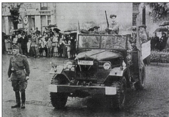
1. kép. Karhatalmisták 1957-ben