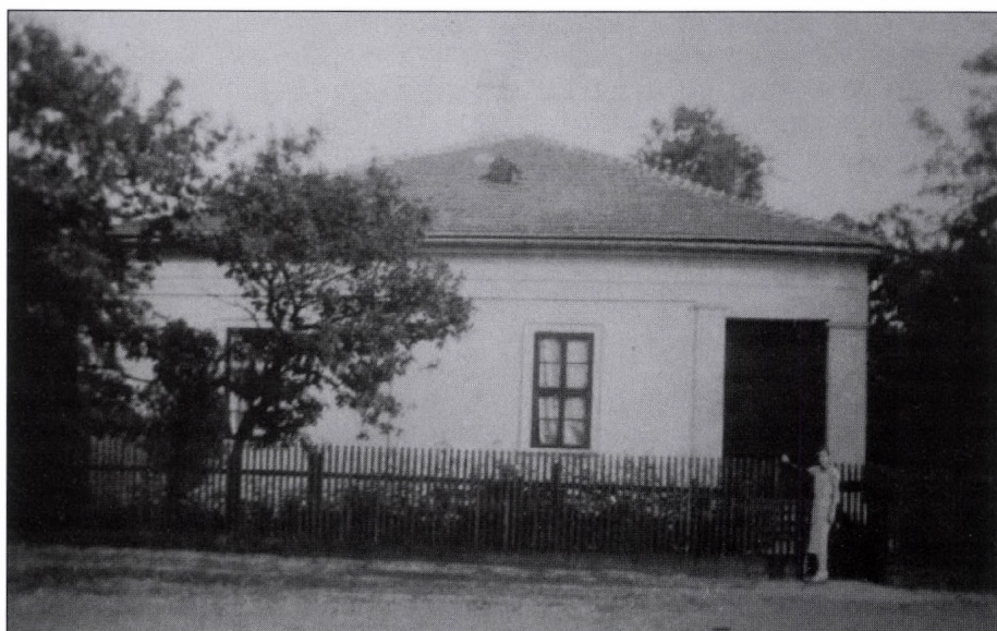
4. kép. A csorvási Sztojanovits kúria oldalnézete