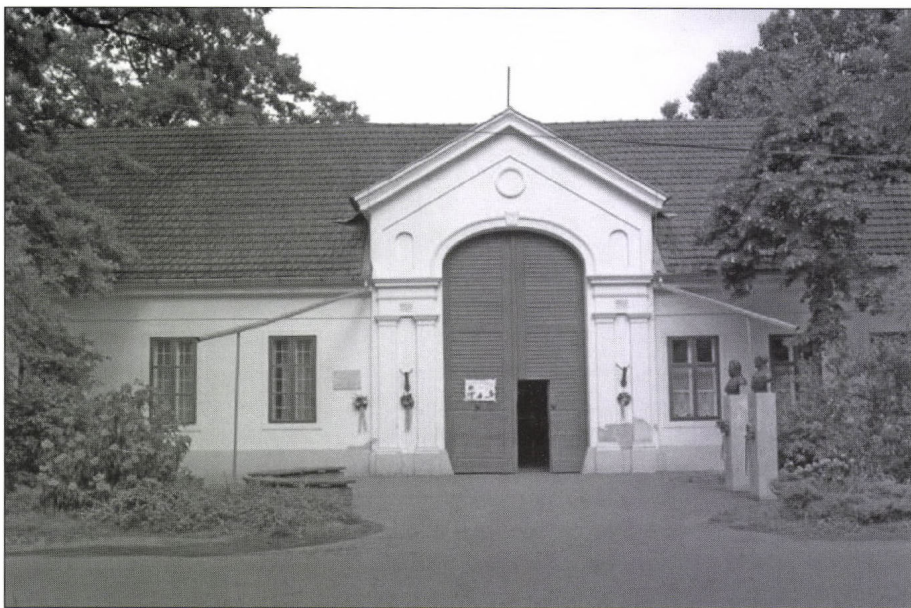
3. kép. Az 1805-ben épült körösladányi Wenckheim kastély kapuja