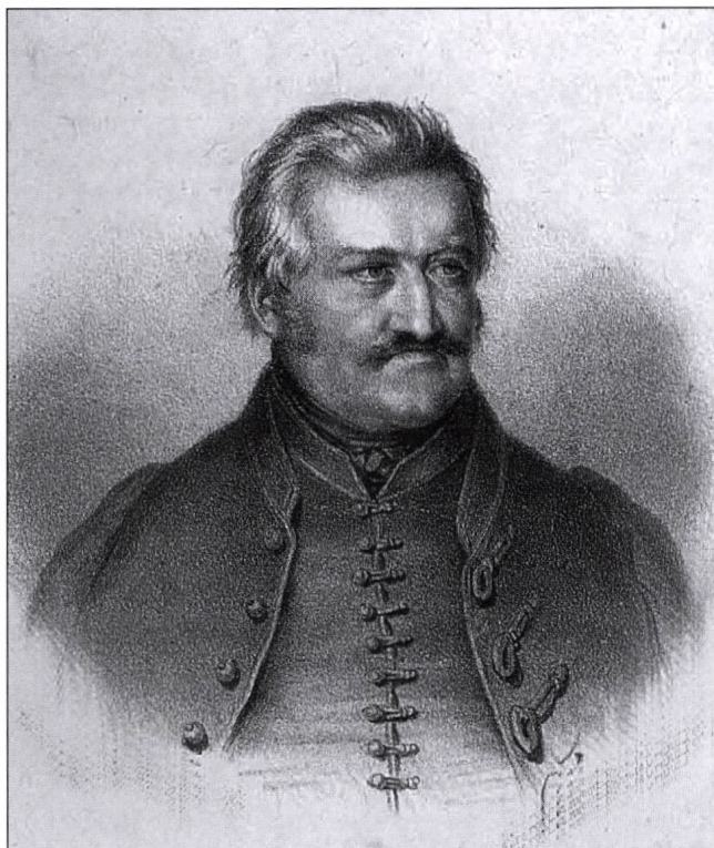
2. kép. Báró Wenckheim József