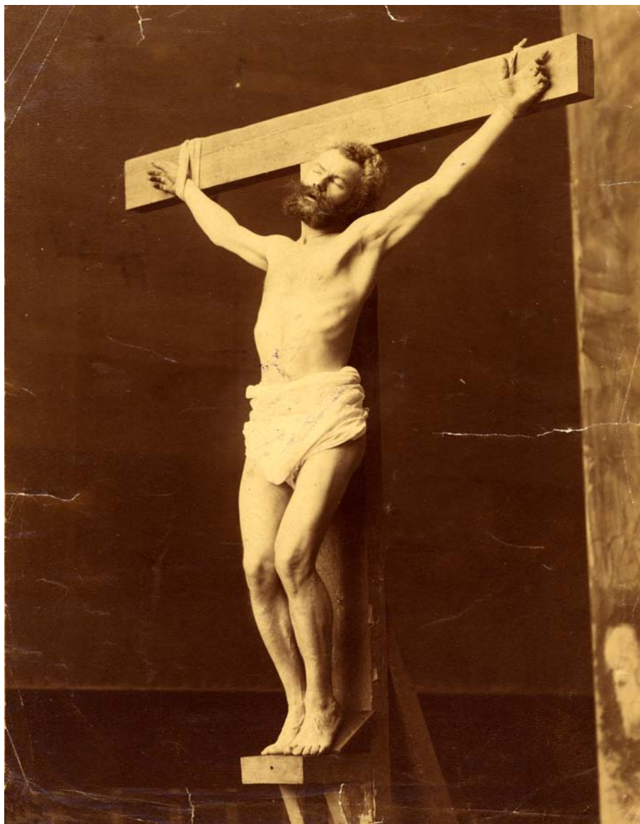
19. kép. De Suse: Munkácsy a keresztfán. Fotótanulmány a Golgota című képhez (1882–1883; fotó, papír; 205 x 157 mm; Munkácsy Mihály Múzeum; leltári szám: 58.26.112)