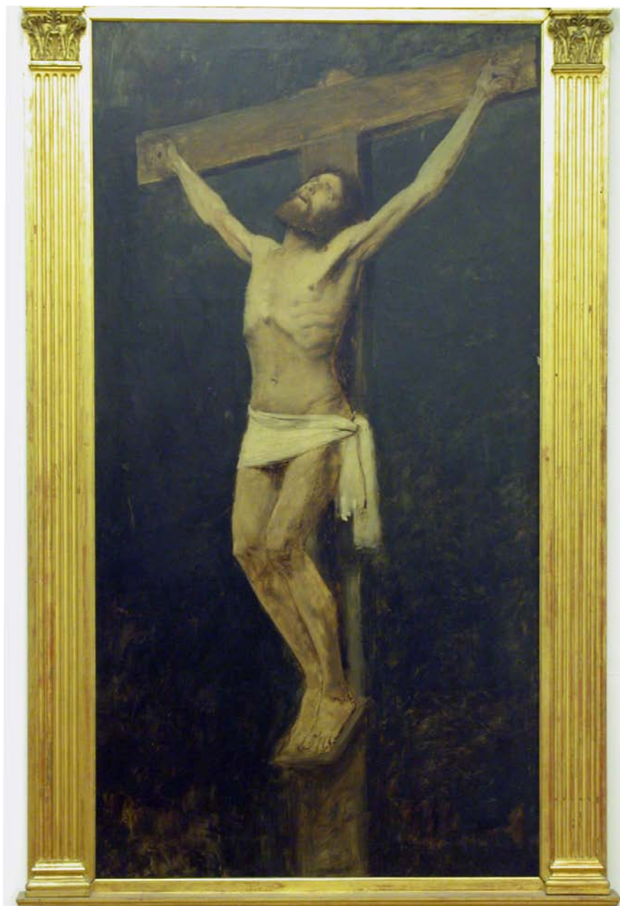
20. kép. Krisztus a keresztfán / Tanulmány a Golgotához (1882–1883; olaj, vászon; 248 x 129,5 cm; jelzés nélkül; Magyar Nemzeti Galéria; leltári szám: 2566)