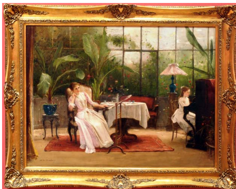
10. kép. A zongoralecke / Pálmaházban (1890-es évek eleje; olaj, fa; 95,5 x 128 cm; jelezve balra lent: M. de Munkácsy; Munkácsy Mihály Múzeum; leltári szám: 62.4)