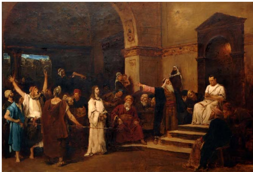
14. kép. Krisztus Pilátus előtt / színvázlat (1880–1881; olaj, vászon; 138 x 199,8 cm; jelezve jobbra lent: M. de Munkácsy 1881; Magyar Nemzeti Galéria; leltári szám: 2565)