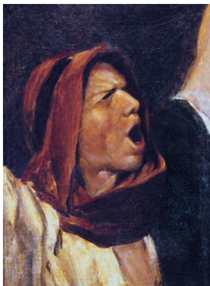
17. kép. Ordító suhanc / Tanulmány a Krisztus Pilátus előtt című képhez (1880; olaj, vászon; 38 x 26,5 cm; jelezve jobbra lent: M. de Munkácsy 80; v. Pákh Imre gyűjteménye, USA)