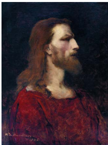
16. kép. Krisztus mellképe / Tanulmány a Krisztus Pilátus előtt című képhez (1880; olaj, vászon; 81 x 65 cm; jelezve balra lent: M. de Munkácsy 1880; v. Pákh Imre gyűjteménye, USA)