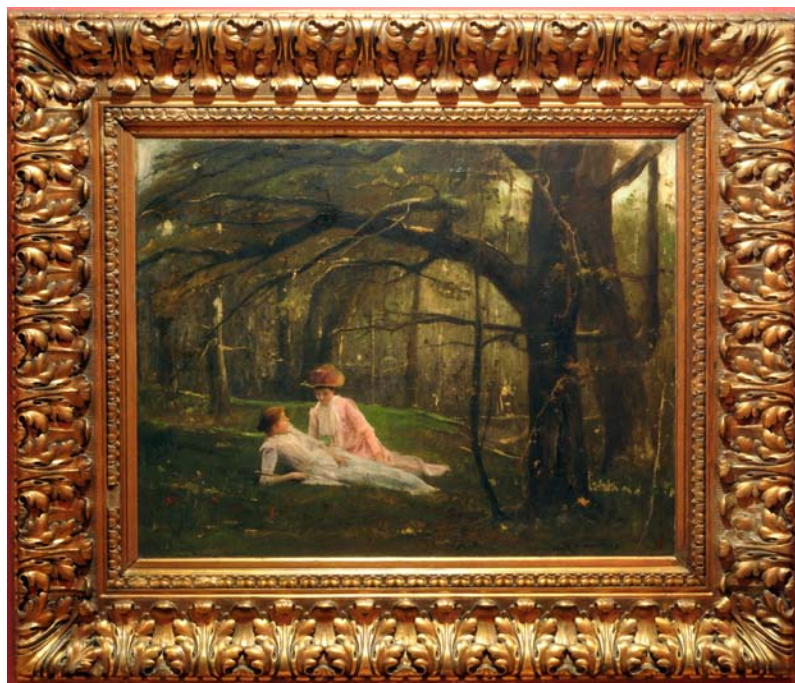
11. kép. Pihenés az erdőben / Csevegés az erdőben (1886; olaj, vászon; 90 x 117 cm; jelezve jobbra lent: M. de Munkácsy; Munkácsy Mihály Múzeum; leltári szám: 62.2)