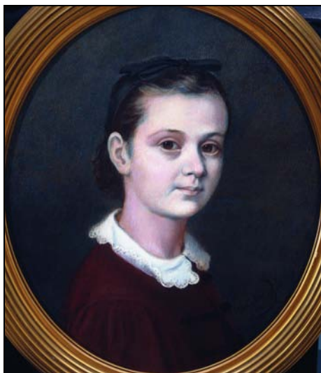
1. kép. Munkácsy Emil leányának arcképe (1863; olaj, vászon; 40 x 34,4 cm; jelezve jobbra lent: Munkácsy 1863; v. Pákh Imre gyűjteménye, USA)