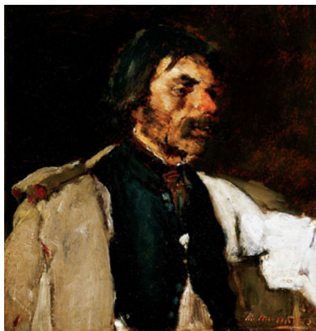
6. kép. Öreg paraszt / Tanulmány a Falu hősé hez (1874 körül; olaj, fa; 39,5 x 34 cm; jelezve jobbra lent: M. Munkácsy; v. Pákh Imre gyűjteménye, USA)