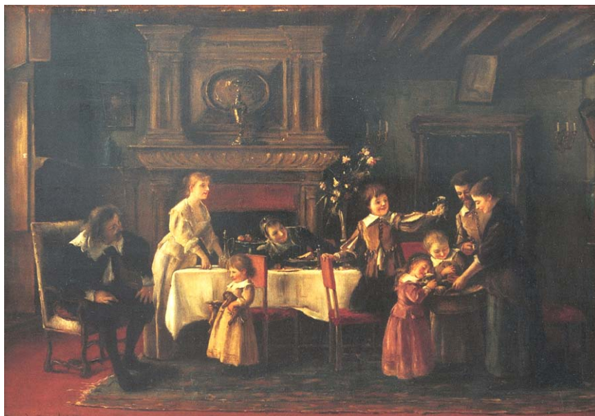
13. kép. Kutyacsalád (1890-es évek; olaj, fa; 73 x 100 cm; jelezve balra lent: M. de Munkácsy; Munkácsy Mihály Múzeum; leltári szám: 62.3)