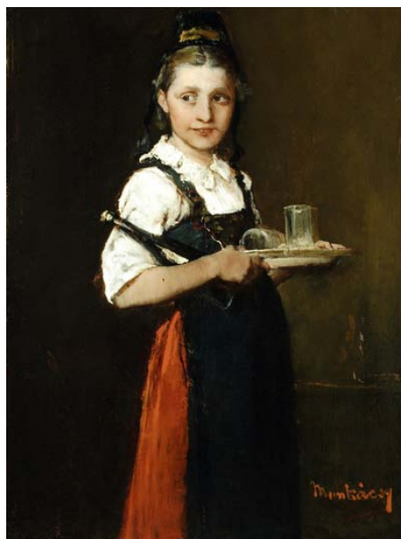
8. kép. Leány tálcával / Felsőszolgálólány (1974–1876; olaj, fa; 55 x 36 cm; jelezve jobbra lent: Munkácsy; Móra Ferenc Múzeum; leltári szám: 50.683.1)