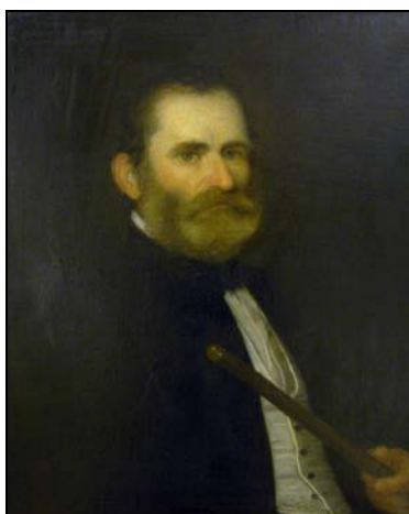
2. kép. Reök Lajos képmása (1864; olaj, vászon; 68 x 55,5 cm; jelezve jobbra lent: Munkácsy M.; Munkácsy Mihály Múzeum; leltári szám: 61.3)