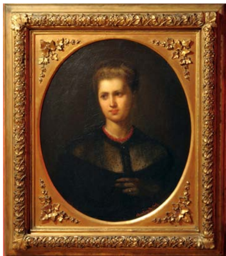
4. kép. Női arckép (1867; olaj, vászon; 75 x 65,3 cm; jelezve jobbra lent: Munkácsy Mihály 1867; Magyar Nemzeti Galéria; leltári szám: 2179)