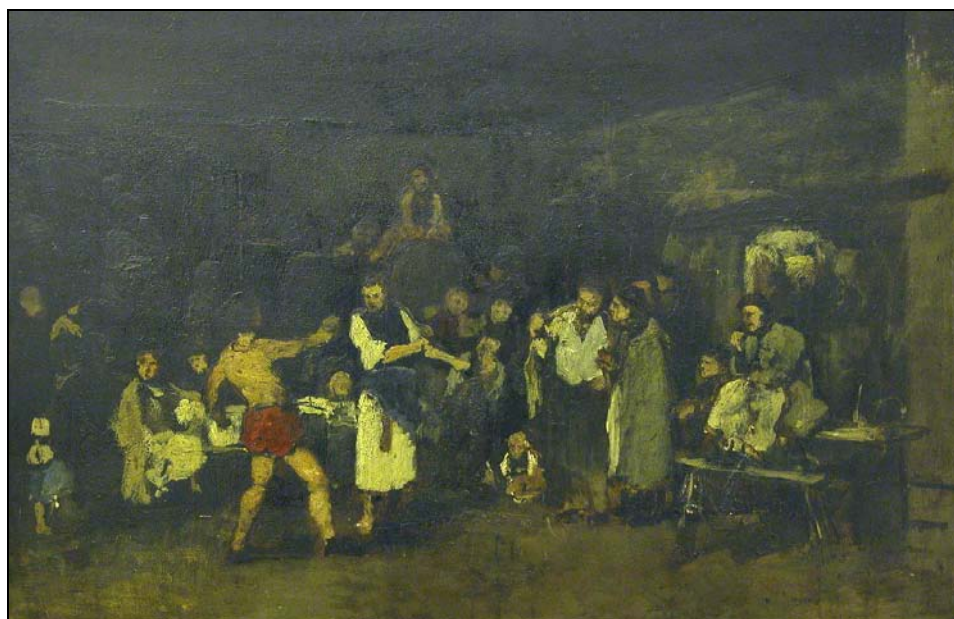
5. kép. Tanulmány a Falu hőséhez (1874–1875; olaj, fa; 67 x 102 cm; jelzés nélkül; Munkácsy Mihály Múzeum; leltári szám: 86.11.1)