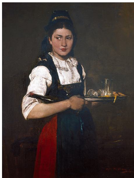
7. kép. Leány tálcával (1876; olaj, vászon; 114 x 82,8 cm; jelzés nélkül; Munkácsy Mihály Múzeum; leltári szám: 87.17.1)