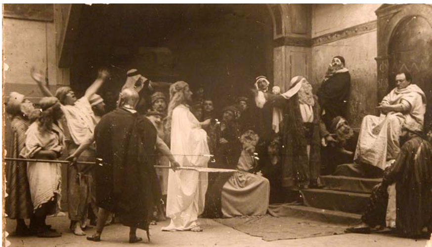
15. kép. Ismeretlen fényképész: Fotótanulmány a Krisztus Pilátus előtt című képhez (1879 körül; fotó, papír; 115 x 165 mm; Munkácsy Mihály Múzeum; leltári szám: 94.1.2)