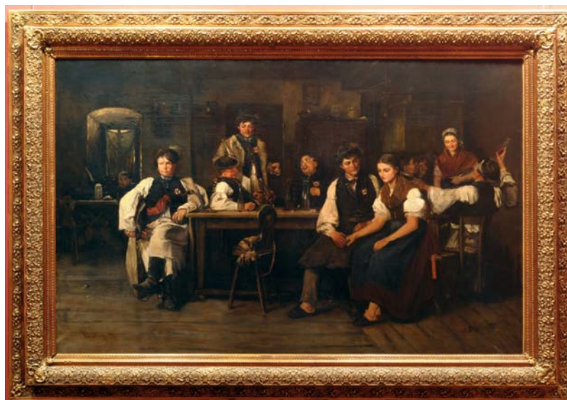
9. kép. Újoncozás (1878; olaj, vászon; 127 x 196 cm; jelezve balra lent: Munkácsy M.; Magyar Nemzeti Galéria; leltári szám: 58.85)