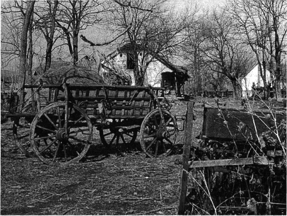
2. kép. Kővágó Sándor háza és udvara, 1987