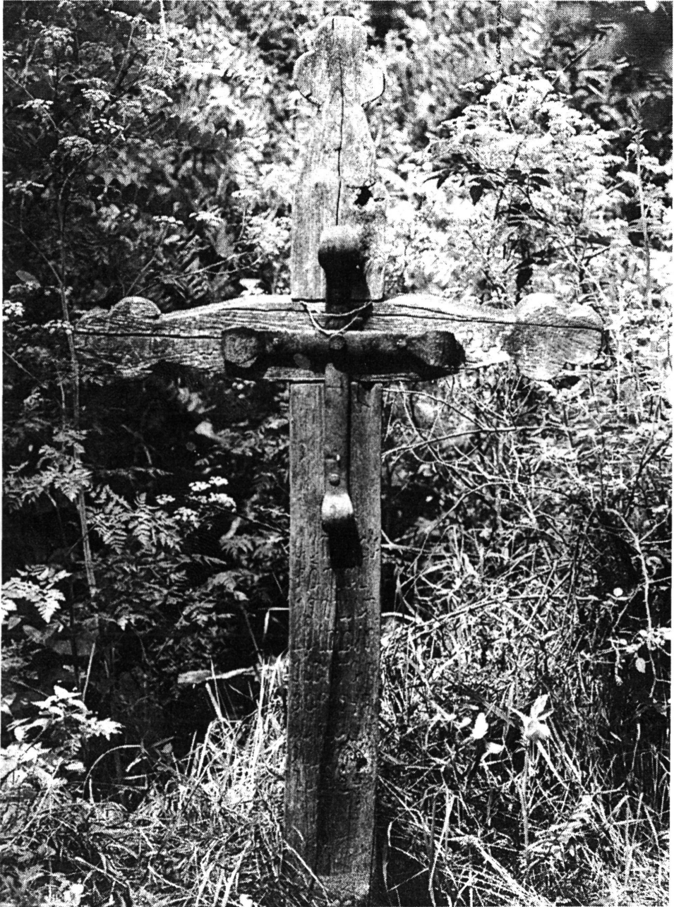
1. kép. Fakereszt, kovácsoltvas díszítménnyel a régi temetőben, Méhkerék, 1979