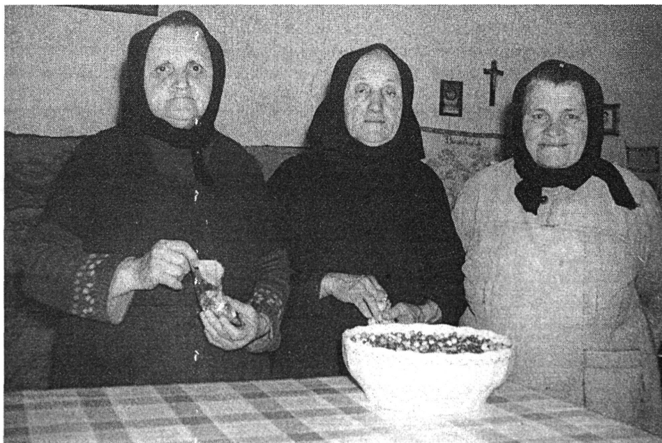
9. kép. Román asszonyok a Szent Tódor napi főtt búzával, „grâu fert”, Méhkerék, 1982