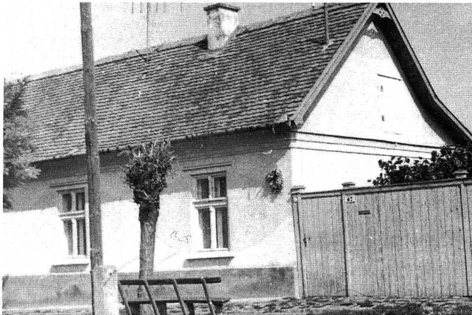
7. kép. Szent Iván napi koszorú egy lakóház homlokzatán, Battonya, 1977