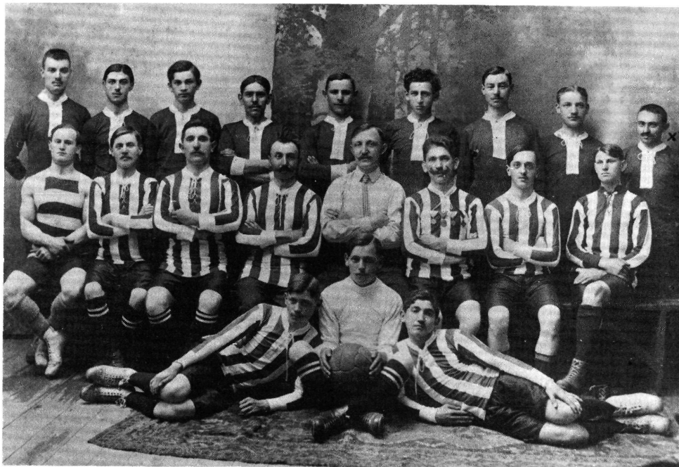
Az Orosházi Testgyakorlók Köre első csapata (1912)