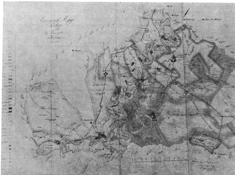
1. ábra: Csongrád Vármegye kéziratos térképe a sámsoni pusztával együtt.

5 ör Továbbá a haszonbér fizetésén és felhozott aratás s nyomtatáson kívül tartoznak a haszonbérelő kertészek minden általok birt hold után két gyalog napot vagy