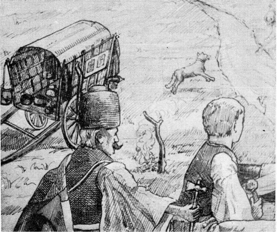
2. kép. A vásárhelyi Levéltárban őrzött Szeremlei Sámuel dokumentáció egy megmaradt rajzának részlete. Pusztai pásztorok a talyiga mellett.

2. Bild: Teil einer Zeichnung der im Archiv von Vásárhely bewahrten Dokumentation von Sámuel Szeremlei. Puztahirten neben der Schubkarre.