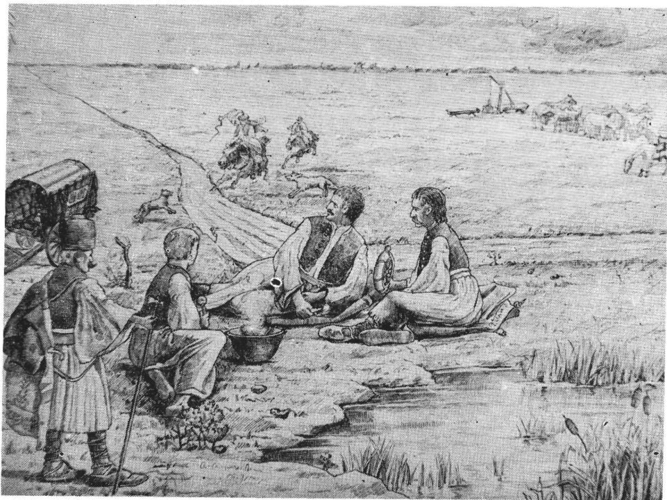
1. kép. A vásárhelyi Levéltárban őrzött Szeremlei Sámuel dokumentáció egy megmaradt rajza a XIX. századi vásárhelyi Pusztáról. A művészileg is gyenge rajz a romantikus pusztaszemléletet tükrözi. 1. Bild: Eine erhaltene Zeichnung der Puszta von Vásárhely im 19. Jahrhundert aus der im Archiv von Vásárhely bewahrten Dokumentation von Sámuel Szeremlei. Die auch künstlerisch schwache Zeichnung widerspiegelt die romantische Auffassung von der Puszta.

A pusztai kutak még fontosabbak voltak. A víz, az állattartás, a legeltetés, a pusztai állattartás egyik alapfeltétele volt. A pusztai kutak környékén levő aklok, karámok, talyigák, gunyhók sohasem fejlődtek szállásokká. A fejlődésnek ez a láncszeme a Pusztán kimaradt. 1847—1852-től már tanyák épültek ezen a területen.