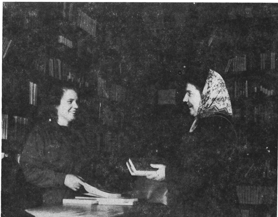
3. kép. Orosháza, Kossuth u. 12. 1952 óta működik itt az államosított, illetve szövetkezeti könyvesbolt. Háttérben a régi polcsorok.