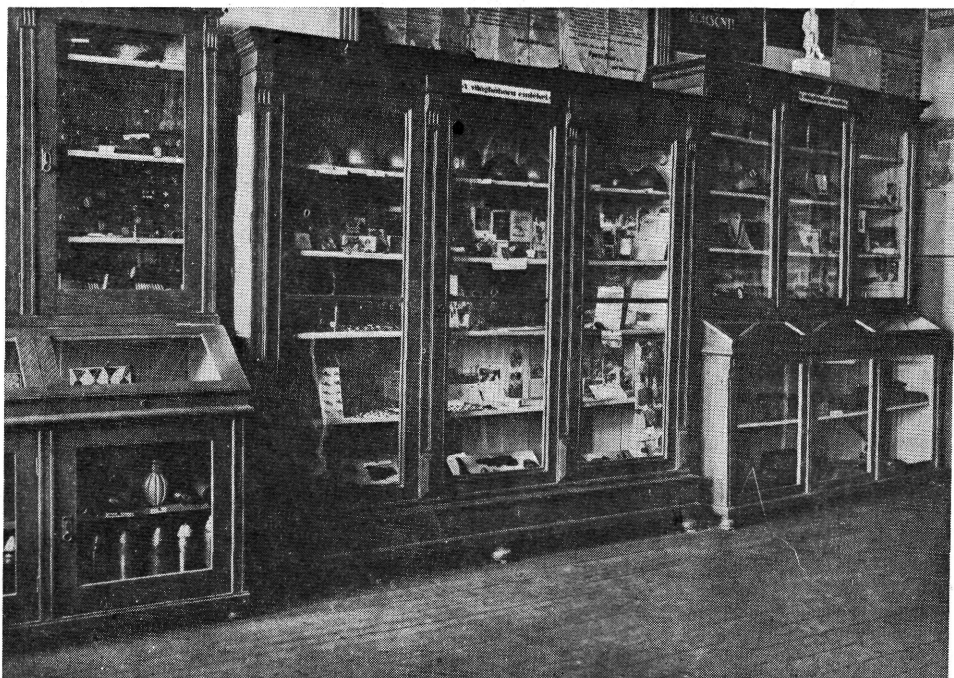
2. 3. 4. kép. Az iskola múzeuma

gatásának, valamint gazdasági és kulturális életének akkori vezetői is. Ezenkívül még a látogatók egész sorának aláírását őrzi vendégkönyvünk. A múzeum megalapításának elképzelése nagy lépéssel haladt előre a megvalósítás útján.