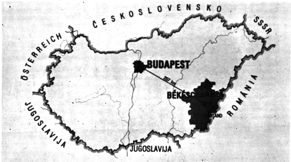
Békés megye földrajzi fekvése Geographische Lage des Komitats Békés