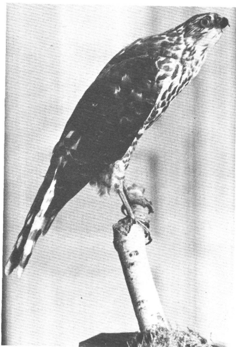
Kis héja ( Accipiter brevipes ) a békéscsabai múzeum gyűjteményében. Kleiner Habicht ( Accipiter brevipes ) aus der Sammlung des Békélsabaer Museums.