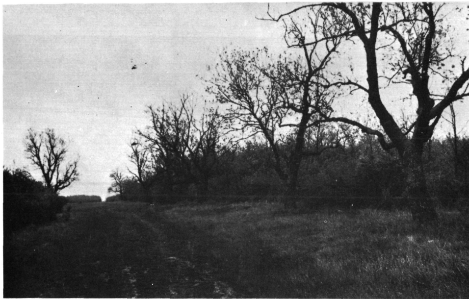
Szabadkígyósi erdős-pusztai biotóp, ahonnan a legtöbb kis héja adatot ismerjük. Ez a kőris-fás út. Szabadkígyóser Waldpuszta-Biotop, woher wir die meisten daten über die kleinen Habichte kennen. Diese ist der Eschenweg.