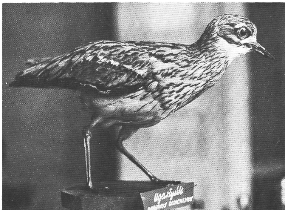
Ugartyúk ( Burhinus oedicnemus ) a madártani gyűjteményben. Adatai a 90. sorszám alatt. Brachvogelhenne ( Burhinus oedicnemus ) in der vogelkundlichen Sammlung. Angaben unter Nr. 90.