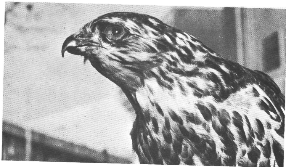
A kis héja mellképe. Brustbild des kleinen Habichts.