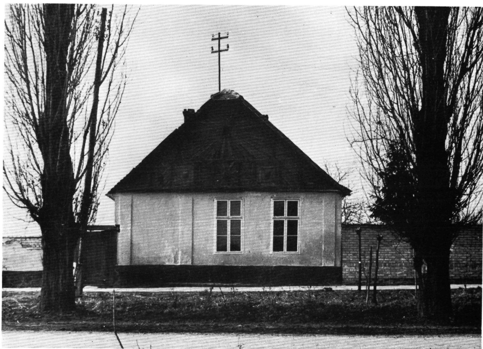
Napsugárhomlokú ház Szőregen, a Petőfi utcában, 1973. Haus mit Sonnenschein—Ornament in der Petőfi-Strasse, 1973.