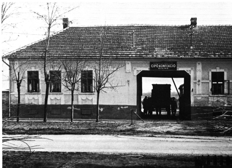
Ipari üzem Szőregen, 1973. Industriebetrieb in Szőreg, 1973.

A dalok átadóit csak a legritkább esetben nevezték meg adatközlőink, konkrét személyt nem szívesen jelöltek meg; annál gyakrabban hivatkoztak régi énekeskönyvekre, amelyekből azonban alig sikerült egyet—kettőt találni a helyszínen. Az egyetlen ép, ezernél több népdalt tartalmazó gyűjteményből jónéhány került a hagyományőrző népi tudatba. 34 Erre vonatkozó tapasztalatunk összecseng a Murko által leírtakkal: „... pjevaju pjesme uglavnom, koje poznajemo iz štampanih starijih i novijih zbirki, koje predstavljaju već cijelu knjižnicu gdje se opijevaju događaji od najstarijih vremena do najnovijeg doba.” 35