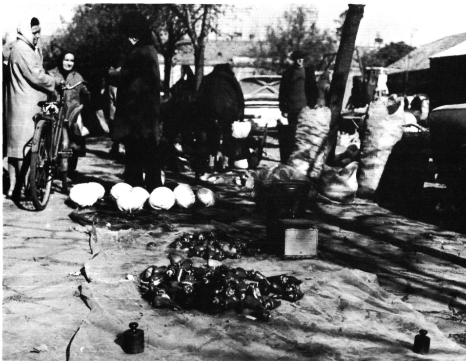
Hetivásár Battonyán, 1973 Wochenmarkt in Battonya, 1973.

A kérdésre adott válasz eldönthette, jó énekes volt-e az átadó, egyszerűsmind kitapinthatóvá vált az egyszerű átadással járó szöveg- és dallamváltozás is.