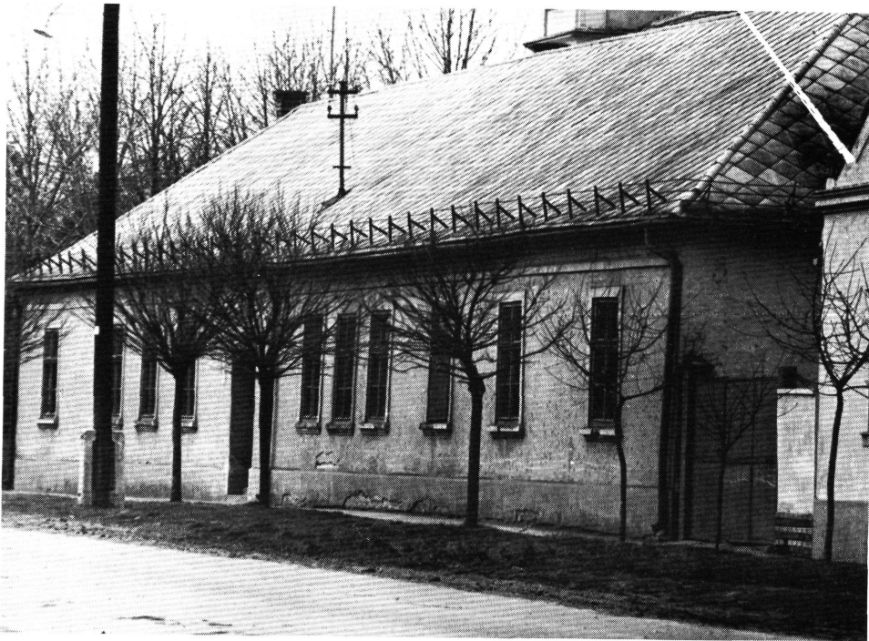
Szerbhorvát tanítási nyelvű általános iskola, Deszka, 1973. Grundschule mit serbo-kroatischer Unterrichtssprache, Deszka, 1973.

Tekintve, hogy a népdalgyűjteményekben, népszerűsítő kiadványokban rendszerint címet is kaptak a népi alkotások, a címadás általában a szöveg könyvből való átvételére utal. (A dallam, az előadás módja könyvből nem sajtítható el, csakis gyakorlat útján!) Mivel azonban a Parry által meghallgatott énekesek analfabéták voltak, ez a feltétel — úgy véljük — azon esetek „kiszűrésére” alkalmas, amikor az ének átadója volt írástudó.