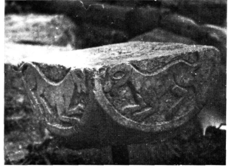
9. kép: A márvány oszlopfőn látható két kutya

Figure 8: One of the sides of the marble capital, the form of a dog being clearly visible