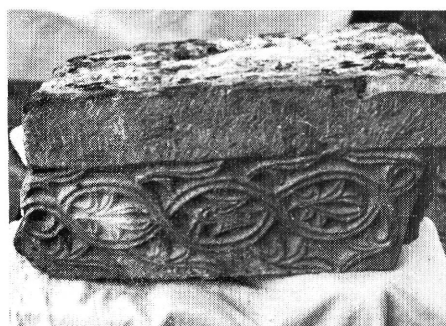
6. kép: A templom nyugati kapujának párkányzat részéről a fonatos, palmettás oldal

Figure 5: Part of cornice of the western door of the church. "Turbaned man".