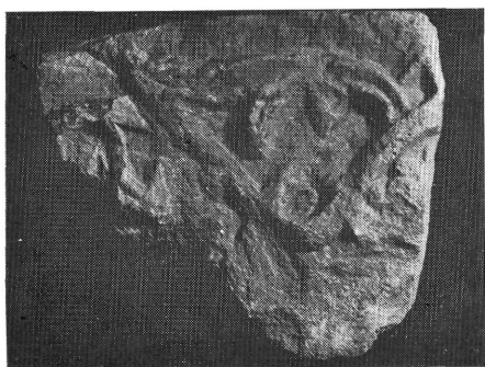
1. kép: Párkánytöredék a templomból

A faragvány anyaga mészkő, hossza 43,5 cm, szélessége 39,5 cm, vastagsága 22 cm. Tetején kapcsolódott a kapu boltozatához, vagy a templom falához, de az indamotívumos rész felől 4,5 cm széles perem (párkányzat) szabadon maradt. A kő baloldala — indamotívumos oldala a szembenézet — elnagyoltan megmunkált, de töredékes is. Jobboldala símára faragott, azonban amint az 5. képen látható 17,5 cm oldalú felületen, 3,5 cm-rel bemélyítve