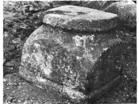
11. kép: Kocka alakú lábazat

Figure 10: Palmetted leaf-motive on the third side of the marble capital