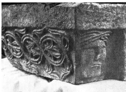
5. kép: A templom nyugati kapujának párkányzat része. „Turbános férfi”.

Figure 4: Foliated scroll-motive fragment from the chancel of the church