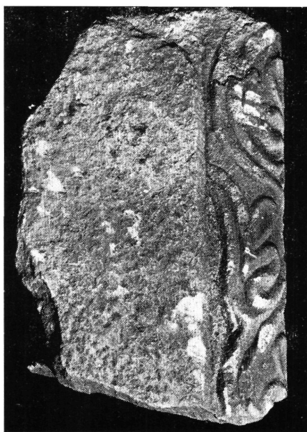
2. kép: Palmettás ajtóbélet a kolostor „A” helyiségéből.