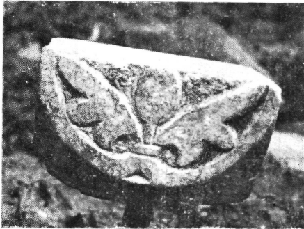
10. kép: A márvány oszlopfő harmadik oldalán levő palmettás levélmotívum

Figure 9: Two dogs visible on the marble capital