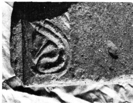
12. kép: Indamotívumos ajtóbélet töredék a templom déli oldalhajójából

Figure 12: Foliated scroll-motive door-frame fragment from the southern side-aisle of the church