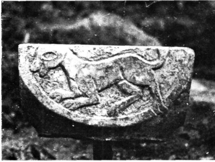
8. kép: A márvány oszlopfő egyik oldala, melyen kutya alakja látható

Figure 8: One of the sides of the marble capital, the form of a dog being clearly visible