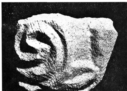
4. kép: Indamotívum töredék a templom szentélyéből

Az oszlopfő méretei: 12×13 cm alapterületű a teteje, magassága 7,5 cm. A kehelyszerű aljkiképzés után kis (letöredezett) nyakkal kapcsolódott az oszlophoz. Itt szintén kúpos lyukba helyezett csapolás rögzítette egymáshoz a két darabot.