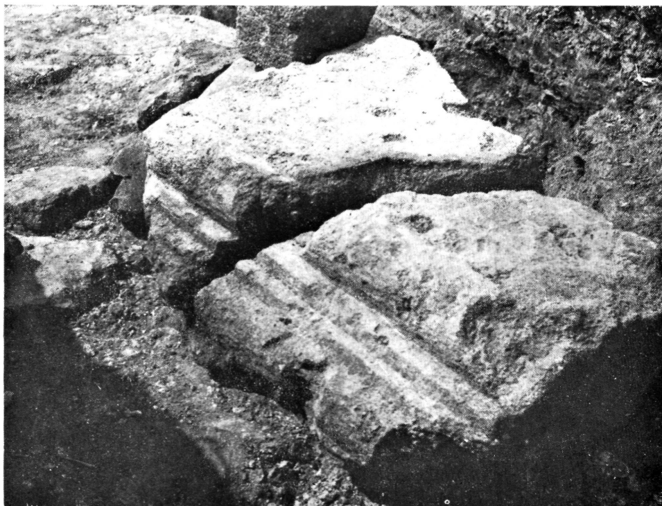
3. kép: Síma, féloszlopos, párkányzatos ajtóbélet részek a kolostor „A” helyiségéből. Figure 3: Smooth, engaged-column, corniced door-frame parts from room "A" of the monastery

A 6. képen bemutatott előlapon, azaz az indamotívumos részen, fent szintén 6,5 cm széles párkány maradt. Ez alatt kissé rézsűsen kialakított 17 cm széles sávban van a fonatos-palmettás minta. Az itt látható motívumnak párhuzamait — jellegében hasonlókat — a XII. századi magyarországi faragott emlékek között megtalálhatjuk. 8