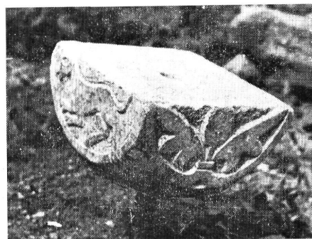
7. kép: Márvány oszlopfő a nyugati kerengő bejárat környékéről

Figure 6: The braided, palmetted side of the cornice part from the western door of the church