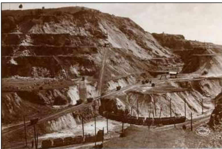
2. képeslap: „ RUDABÁNYA. A rudabányai barnavasércbányászatnak »Andrássy II« nevű bányarésze ”