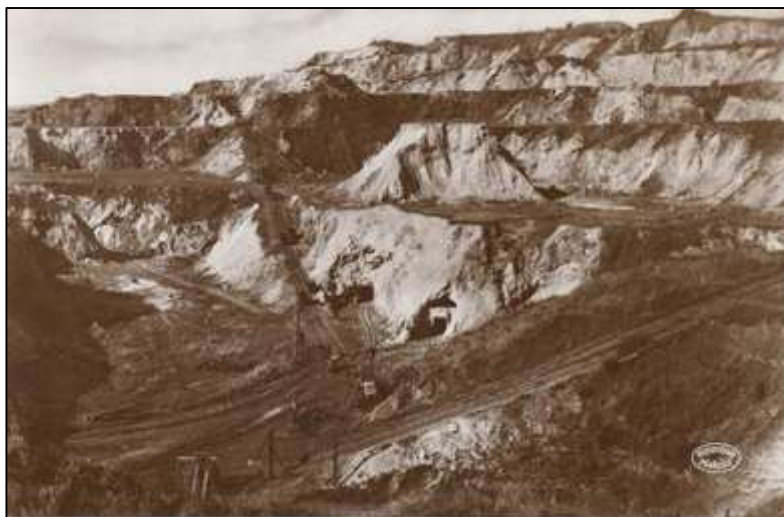
3. képeslap: „RUDABÁNYA. A rudabányai barnavasércbányászatnak »Andrássy III« nevű bányarésze”