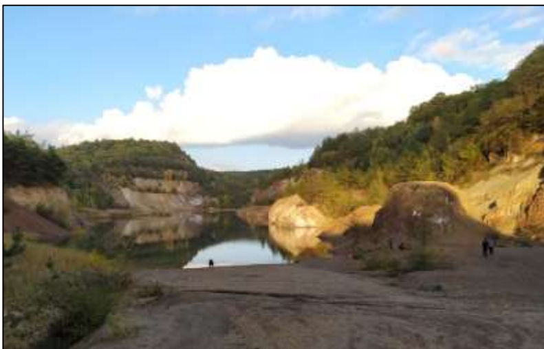
Az Andrassy II. bányarész napjainkban. A vasércbánya 1985-ben történt bezárása után itt alakult ki hazánk legmélyebb tava