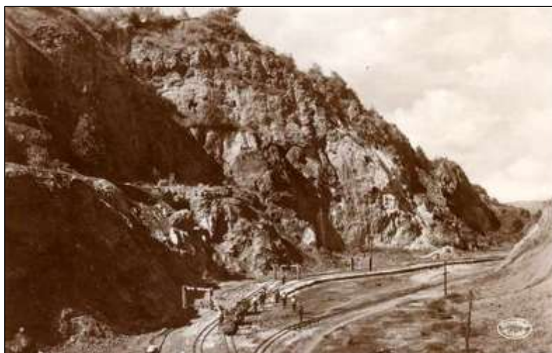
4. képeslap: „RUDABÁNYA. A rudabányai barnavasércbányászatnak »Vilmosbánya« nevű bányarésze”