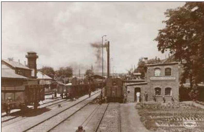
5. képeslap: „RUDABÁNYA. A vasércbányászat rakodóállomása”