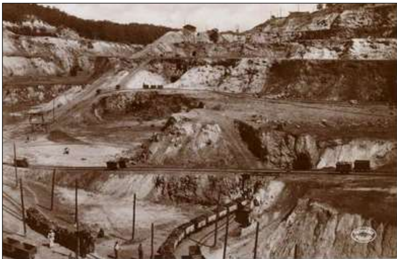
1. képeslap: „ RUDABÁNYA. A rudabányai barnavasércbányászatnak »Andrássy II« bányarésze ”