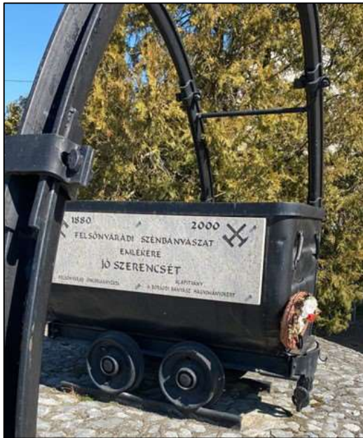
A felsőnyárádi szénbányászat emlékműve.