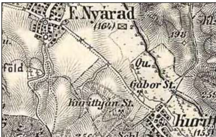
A Gábor-tárna és a Kurittyán-tárna Kurittyán község határában. (A Harmadik katonai felmérés térképéről. Forrás: internet)