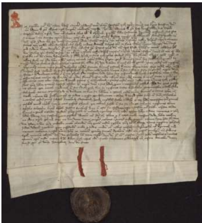
Oklevél 1330-ból.