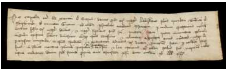
Okirat 1320-ból.