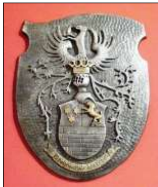
A Pelsőci Bebek (balra) és a Giesche család címere.