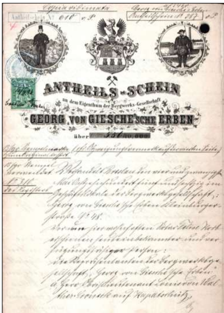
A Georg von Giesche'sche Erben részvénytársaság részvénye.