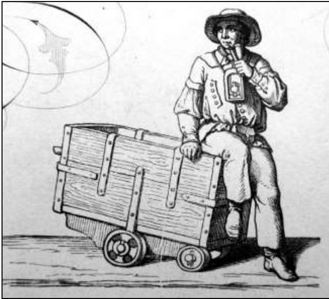
10. kép. Heuchler címlapképe a pipázó csilléssel.