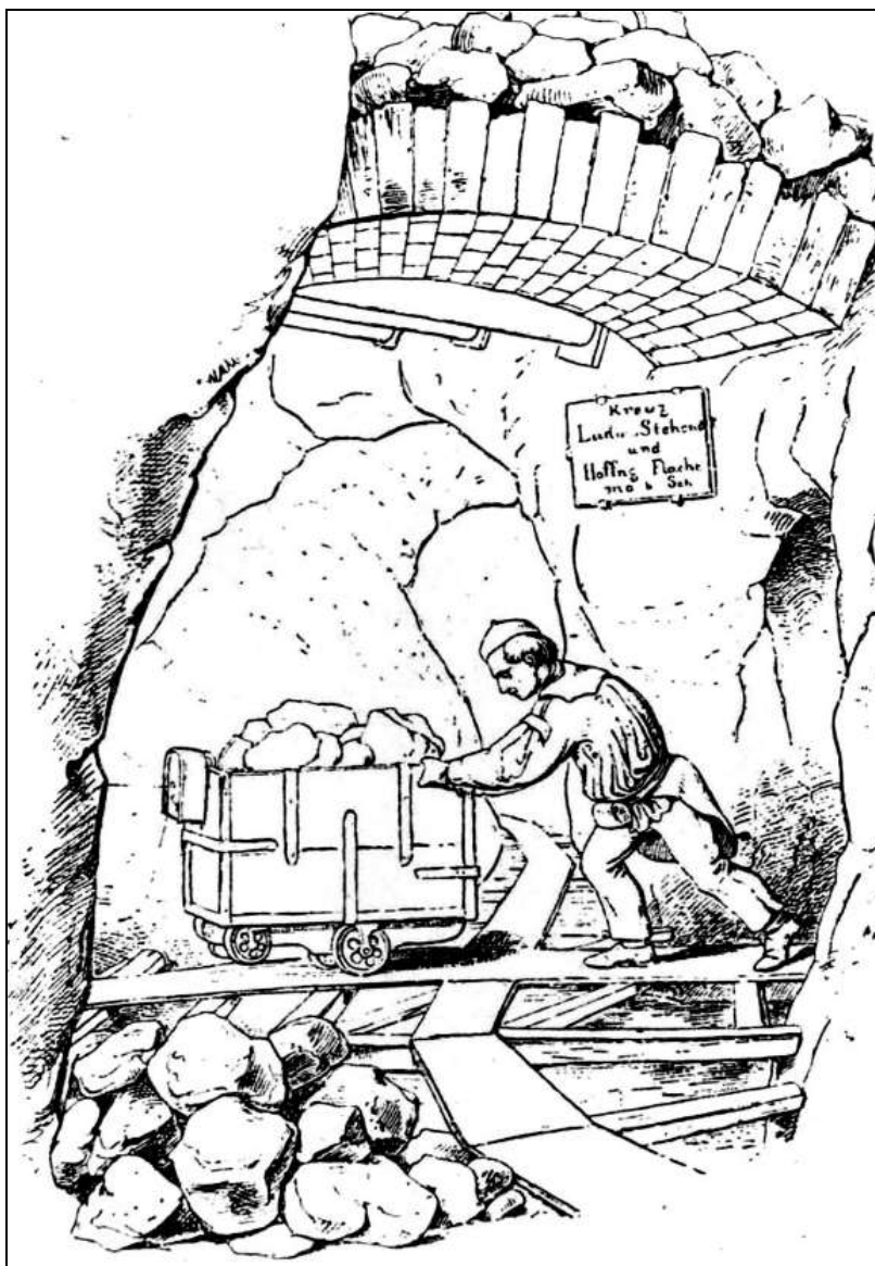
12. kép. Magyar csillét toló freiberger csillés Heuchler litográfiáján.