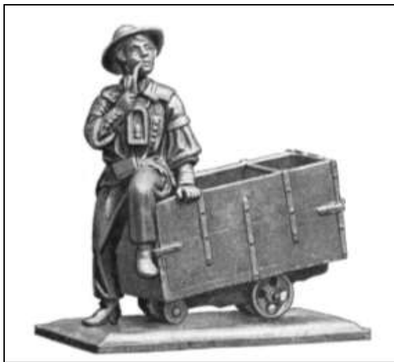
13. kép. A Heuchler tervei alapján készült német szobor fényképe Treptowitzól.