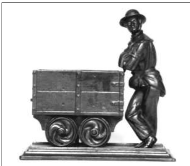
14. kép. Csillére támaszkodó bányász, kissé alulról.