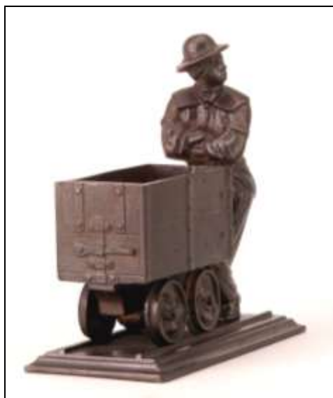
2. kép. Csillére támaszkodó bányász, előlről.