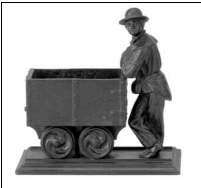
1. kép. Csillére támaszkodó bányász, oldalnézet.