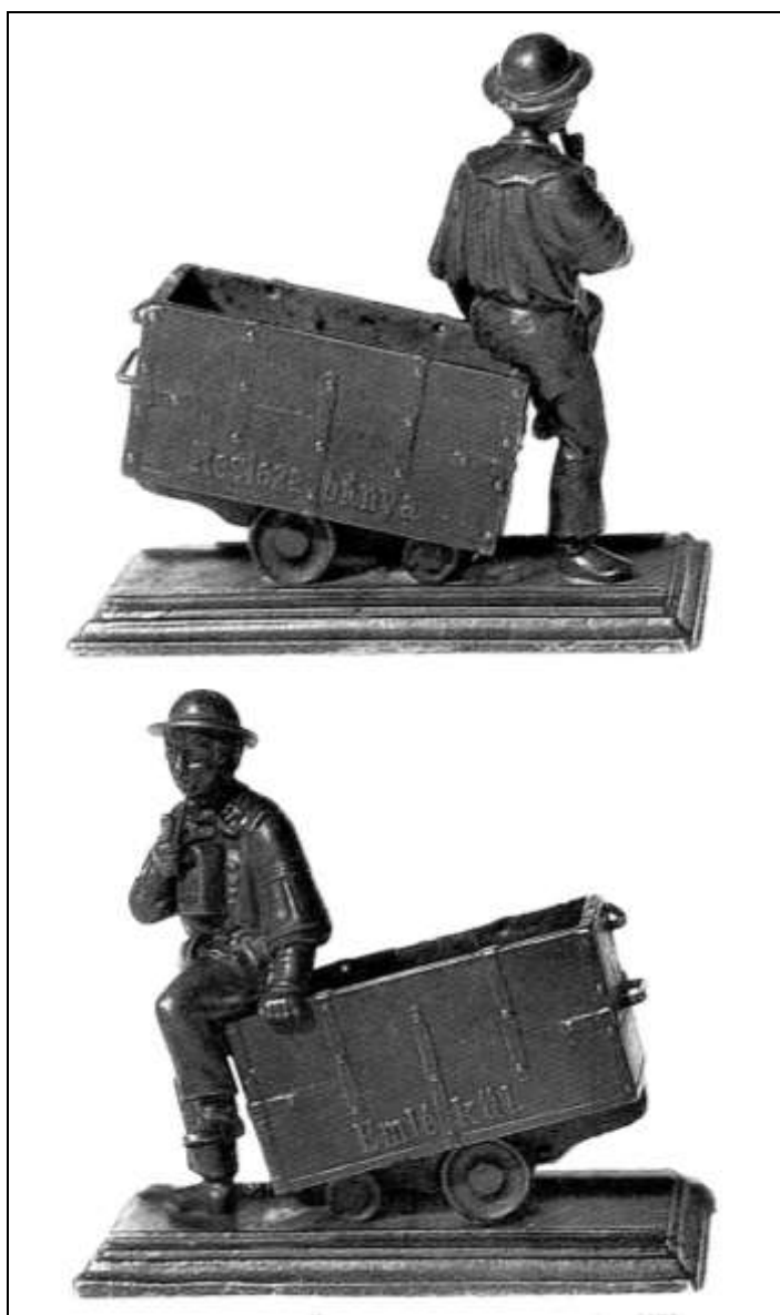
9. kép. A rescabányai szobor elő- és hátoldala.