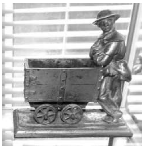
3. kép. Csillére támaszkodó bányász, egyenes küllős csillekerekkel.