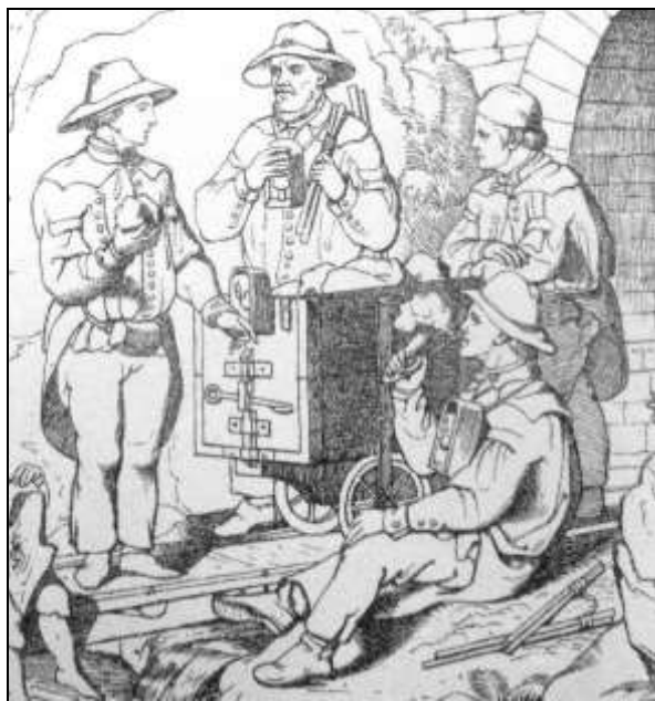
8. kép. Csillére támaszkodó bányász. Heuchler litográfiájának részlete.