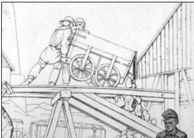
7. kép. Csille ürítése. Heuchler litográfiájának részlete.