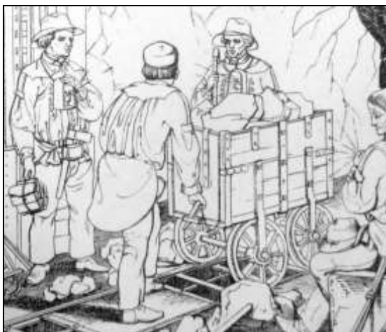
6. kép. Csillések. Heuchler litográfiájának részlete.