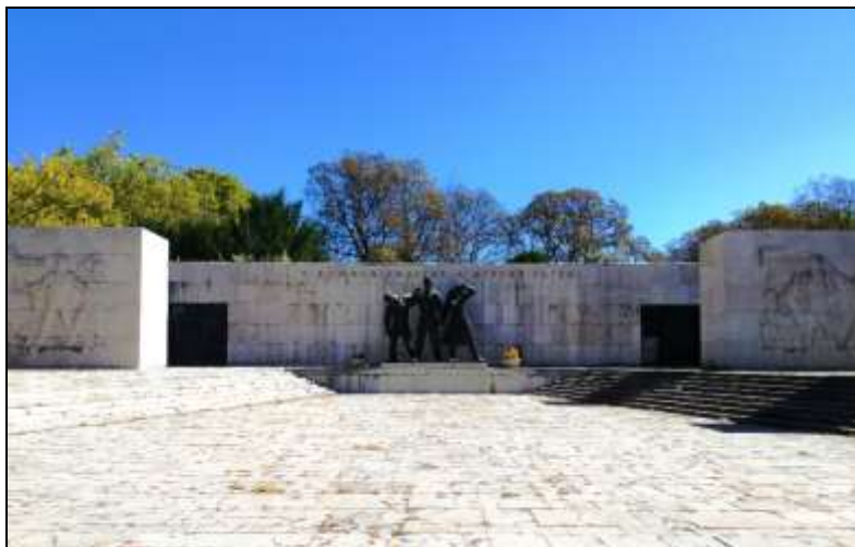
A Munkásmozgalmi Mauzóleum a Fiumei úti sírkertben.