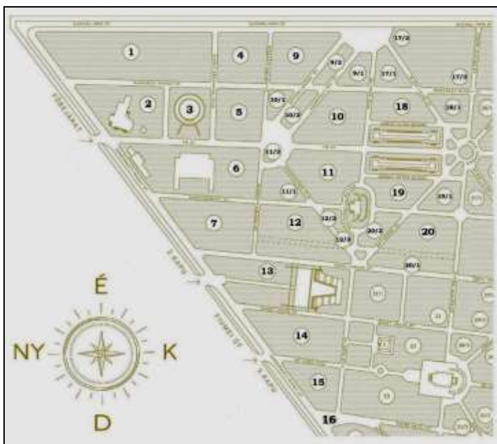
2. ábra. A tanulmányban szereplő parcellák részletes helymegjelölése (A https://fumeiutisirkert.nori.gov.hu nyomán Oláh Róbert, 2019).

Századunk technológiai fejlődésének fényében sokszor elfeledjük, hogy a szakma hazai kiválóságainak milyen nehéz volt lerakniuk az alapokat. Tanulmányommal a jelen és a jövő generációinak háláját szeretném kifejezni az itt felvonultatott személyek iránt, akik kiváló munkásságukkal gyarapították a hazai és az egyetemes bányászatot