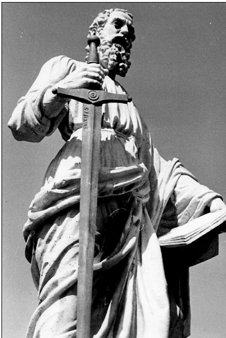
Az egri bazilika előtt álló, Szent Pál apostolt ábrázoló szobor kezében lévő kard is Szilvás feliratot visel.