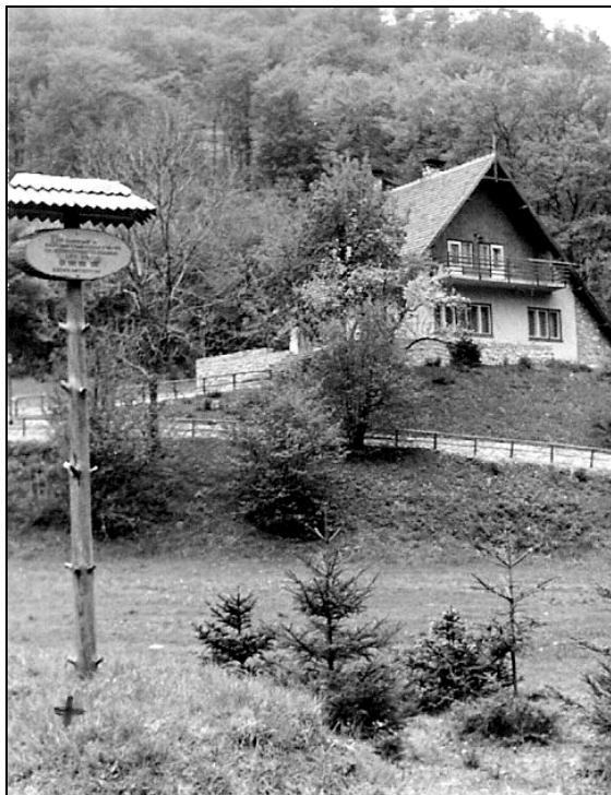
A szilvási vashámor egykori helye a Szalajka-völgyben.

mezőgazdasági szerszámokat (ásó, kapa stb.) a téli üzemszünet idején az Alföldön saját maguk értékesítették, addig Keglevich gróf a munkásait készpénzzel fizette. 20