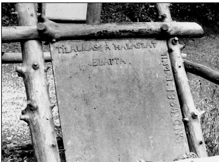
„Tilalmas a halászat ebatta” feliratú öntöttvas tábla.

vácsoltvasat, és 8000 (bécsi) mázsa (4480 q) öntvényeket. Kemény vascsövének egy részét Gömörből hozatja, van ezen kívül a szilvási határban 4, a nekézsenyiben 1, az apátfalviban szintén 1 vas-kőbányája. Faszenet helyben égettet.” 50 Fényes Elek 1851-ben egyaránt működőnek említi a vasolvastót és a hámort. Tudjuk, hogy az ő adatai az 1840-es évek második felére érvényesek, viszont könyve a forradalom és szabadságharc miatt később láthatott napvilágot, ezért nem tartjuk tévedésnek. Egyszerűen az történt, hogy mire a könyve megjelenhetett, adatainak egy része elavult. 1864-ben Pesthy Frigyes helynévgyűjtése a frissítőmű létezéséről tudósít. 51