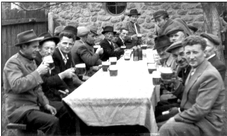
4. kép. Rudabányai bányászok a Sörkertben. Itt éppen sört isznak, de a pálinka sem hiányozhatott a sorból. (1960 körül.)