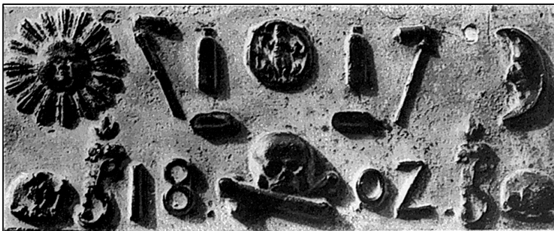
1. kép. Öntöttvas bányász síremlék 1802-ből, pálinkás butykossal.