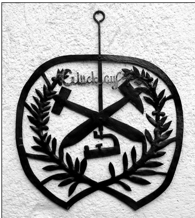
2. kép. Bányászokcsma-céger Brennbergbányáról.