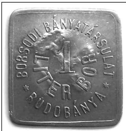
3. kép. A Borsodi Bányatársulat rudabányai borbárcája. (1900 körül.)

A bányatársaság is igyekezett gondoskodni a munkások pálinka- és borszükségetéről: az üzemi „magazinban” italbárcákat is beválthattak tetszés szerint. 2 Ez azonban csak töredékét fedezte az „igényeknek”. Így aki tehetett, saját maga is főzetett pálinkát, aki nem, az időnként kisebb-nagyobb mennyiséget vásárolt a szomszédoktól vagy valamelyik cimborától, aki pedig egyik lehetőséggel sem tudott élni, az a kocsmára fanyalodott.