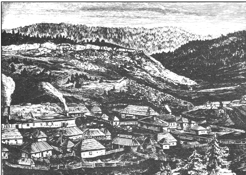
A borszéki üvegyár távlati képe Orbán Balázs: A székelyföld leírása c. művében. (Az eredeti képaláírás: „Alsó-Borszék az üvegcsűrről és a háttérben pompálkodó Kerekcsék sziklagerinczével”.)

A termelés 1808-ban már három kemencében zajlott, 20-30 olvasztófazékkal. Orbán Balázs Székelyföld leírása című művének (1882) 118. oldalán látni a mellékelt korabeli metszetet a füstölgő üvegcsűrről.