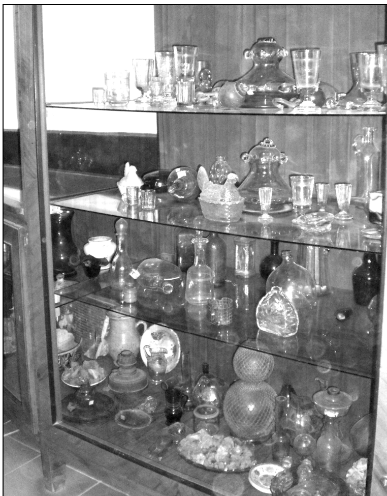
A borszéki üvegyár termékei a Borvíz Múzeum tárlójában

szeti Múzeum gyűjteményében található egy ivópohár, valamint a Semmelweis Orvostörténeti Múzeumban berendezett Képek a gyógyítás múltjából. Fürdőügy Magyarországon című kiállításon (IV. terem) látható két ivópohár (megtekinthetők a múzeum honlapján is).