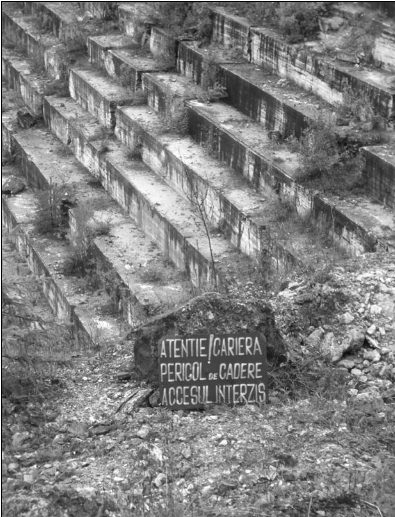
1. kép. Veszélyre figyelmeztető tábla a felhagyott bánya szélén. A háttérben a kitermelés után visszamaradt mésztufa-lépcsők láthatók.