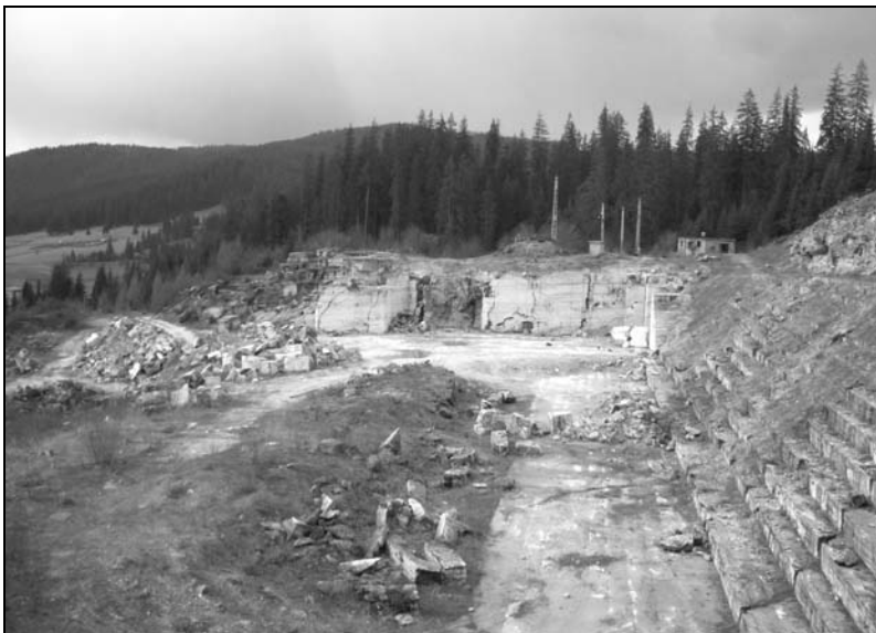
2. kép. Bányaudvar, jobbra a lépcsőzetes fejtés nyomai.