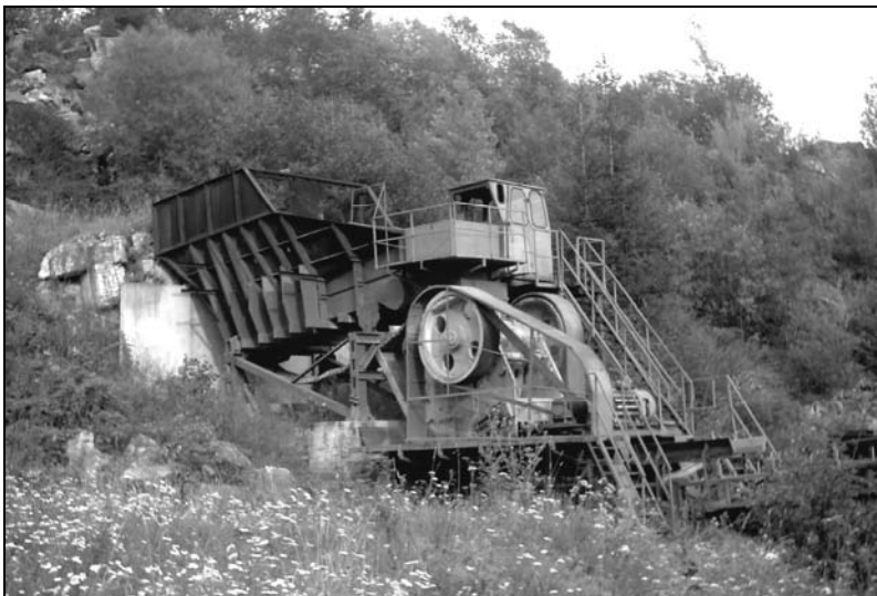
4. kép. Elhagyott kőtörő berendezés.