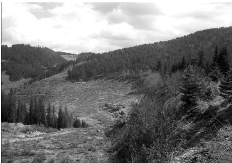
5. kép. Rekultivált kőfejtő Borszék határában.