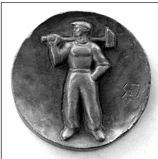
A Magyar Állami Szénbányák munkaverseny-díja, 1948. (Szabó Iván bronzplakettje, átmérője 13 cm. A Borsod-Abaúj-Zemplén Megyei Bányászattörténeti Múzeum, Rudabánya gyűjteményéből.)

A feladatok végrehajtása érdekében szakszervezetiünknek mozgósítania kell a bányáiparban foglalkoztatott összes dolgozókat. Ezért szükséges, hogy a Szakszervezetek Országos Tanácsa VII. kongresszusa határozatának értelmében kialakítsuk az eddiginél fejlettebb szervezeti formát, amellyel a bányászatban foglalkoztatott összes dolgozót egy szakszervezetbe tömörítsük. A XIV. kongresszus felhatalmazza az új központi vezetőséget, hogy a Szakszervezetek Országos Tanácsa irányításával hozza létre a bányászatban dolgozók egységes ipari szervezetét.” 1