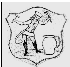
Dobsina címere egy 17. század végi bánya- és kohórendtartásból.

Már a kiadás előkészületei közben sejteni lehetett, hogy nagy sikere lesz a hiánypótló könyvnek. A példányszámnak azonban gátat szabtak az anyagi lehetőségek, így mindössze 1000 darabot nyomtathattak belőle. Ez a mennyiség azonban a megjelenés óta eltelt alig négy hónap alatt szinte teljesen elfogyott. Csak remélni lehet, hogy a második – esetleg javított és bővített – kiadás nem sokáig várat magára.